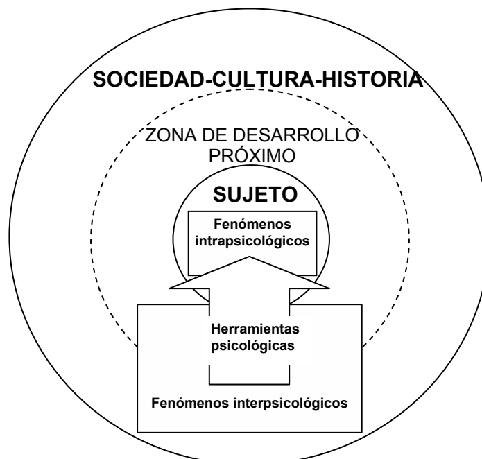
FIGURA 3: INDIVIDUO Y SOCIEDAD SEGÚN VYGOTSKI

- Podemos resumir las ideas expuestas en el esquema de la figura 3: