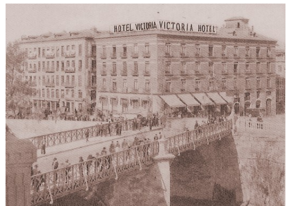
Panorámica del Hotel Victoria

Usó su fama y contactos para fundar el Instituto del Radio, en honor a su marido. Unos años después recibió un segundo premio Nobel, algo sin precedentes, esta vez el de Química en 1911, por descubrir el "Polonio" y el "Radio". Después de la Primera Guerra Mundial se dedicó a promover las terapias radiológicas en otros países consiguiendo importantes donativos para crear la Fundación Curie, dedicada al tratamiento del Cáncer.