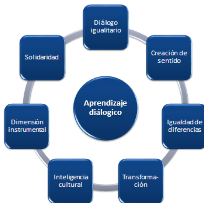
Figura 2. Aprendizaje dialógico.