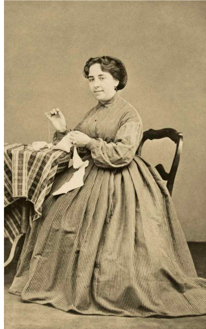
Retrato de dama cosiendo Anónimo. Madrid, España. 1889