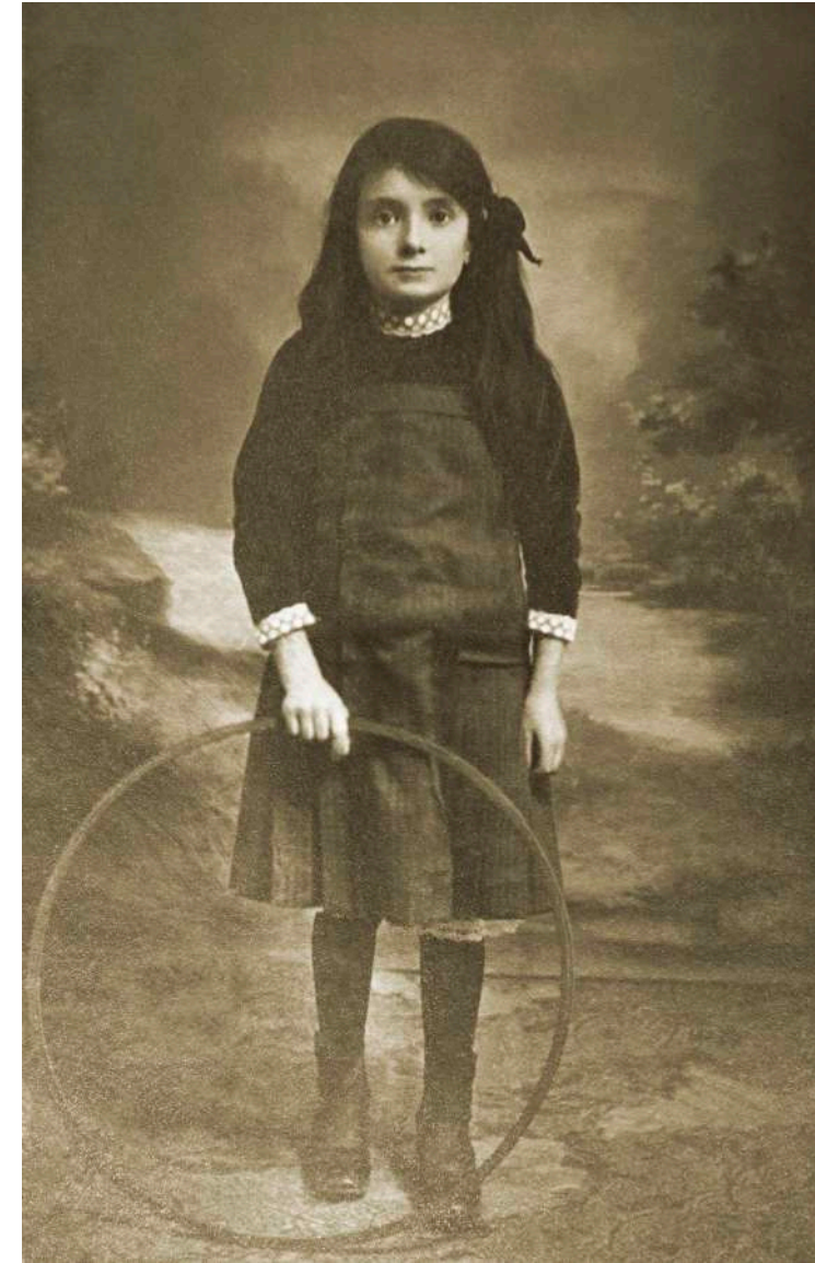
Retrato de niña con aro E. Bartoli. Lyon, Francia. 1899