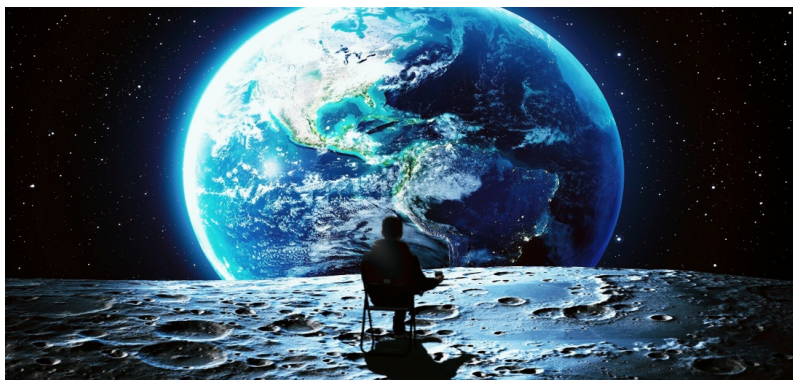
Autor: Francisco José Guillén Navarro

2. En la imagen se observa un mapa geológico sintético. De él diga lo siguiente: