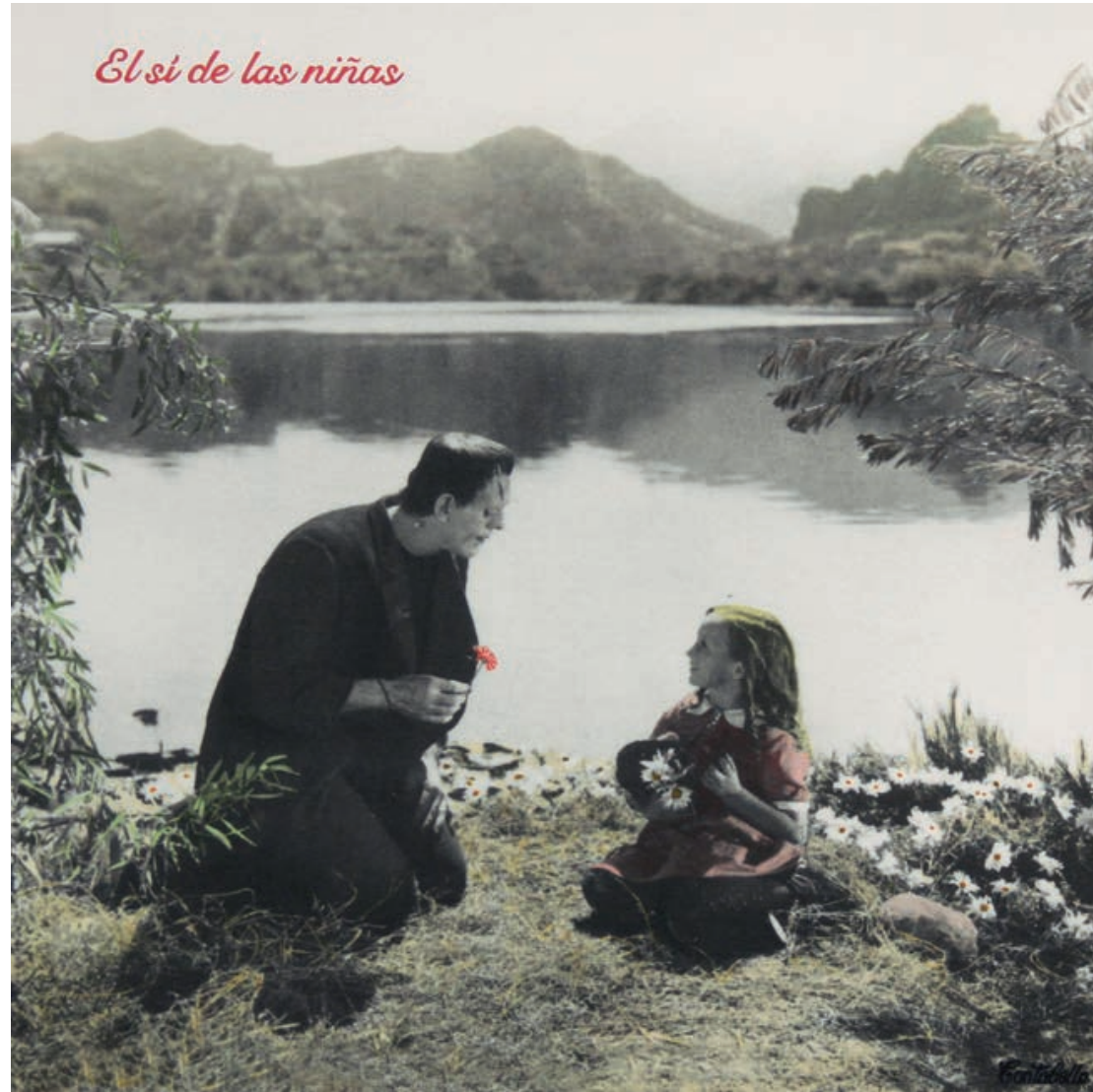
El sí de las niñas Acrílico e impresión digital sobre lienzo 50 x 50 cm. 2019