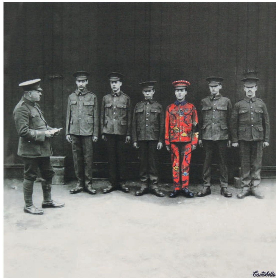
All you need is pop. (Uniformes) Acrílico e impresión digital sobre lienzo 50 x 50 cm. 2019