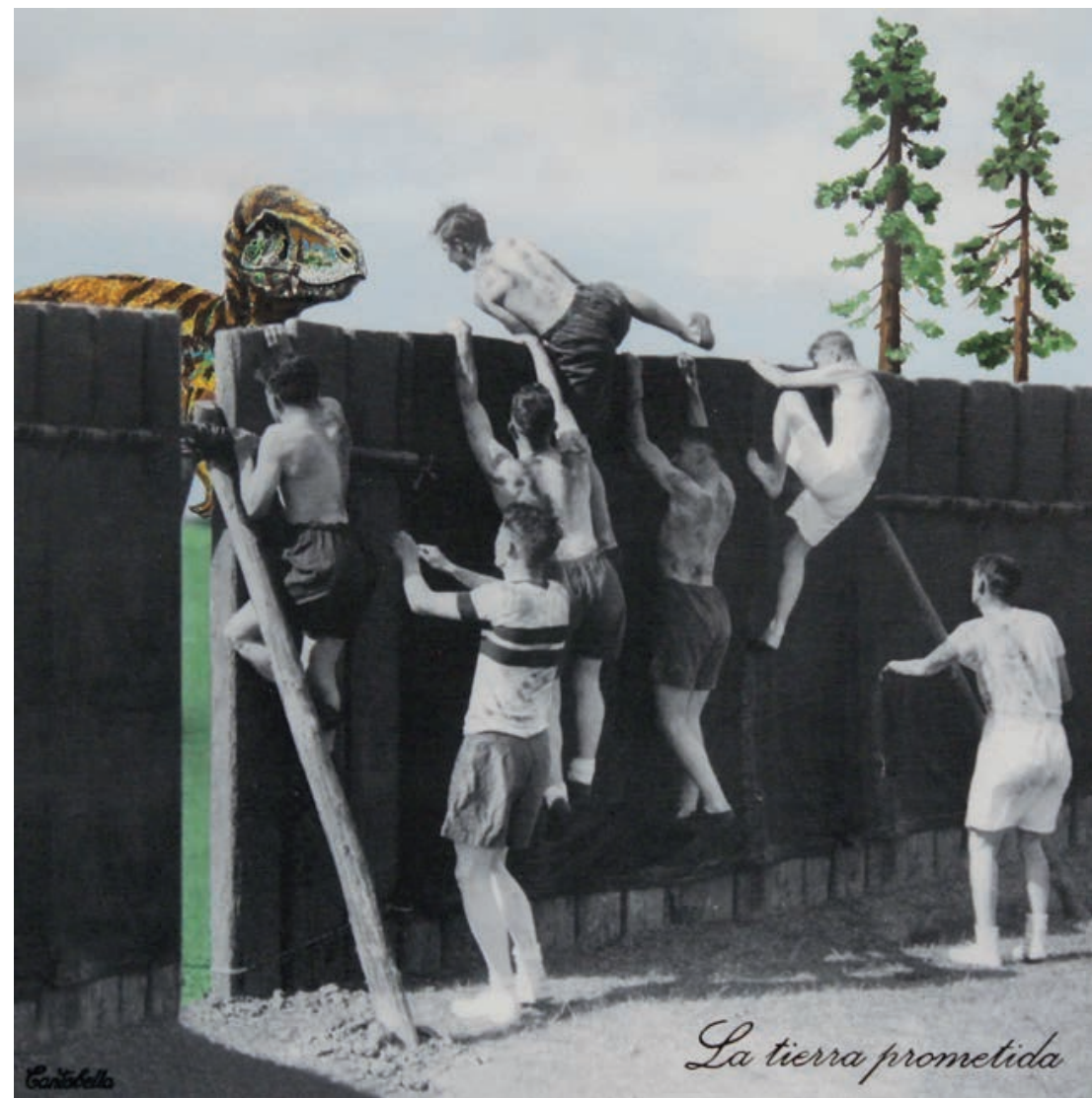
La tierra prometida Acrílico e impresión digital sobre lienzo 50 x 50 cm. 2019