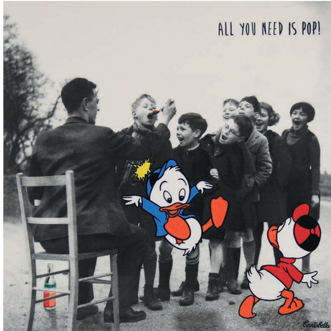
All you nee is pop!. (Patitos) Acrílico e impresión digital sobre lienzo 50 x 50 cm. 2019