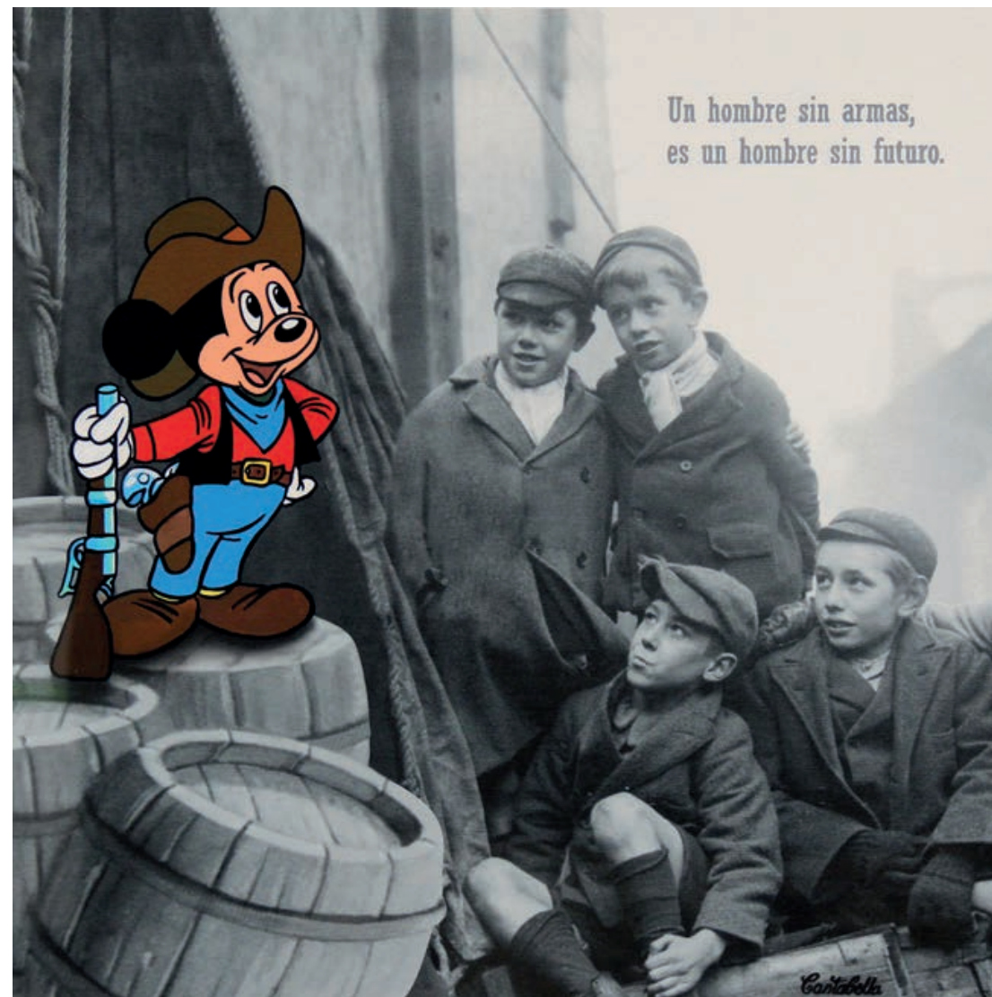
Un hombre sin armas es un hombre sin futuro. (Mickey) Acrílico e impresión digital sobre lienzo 50 x 50 cm. 2019