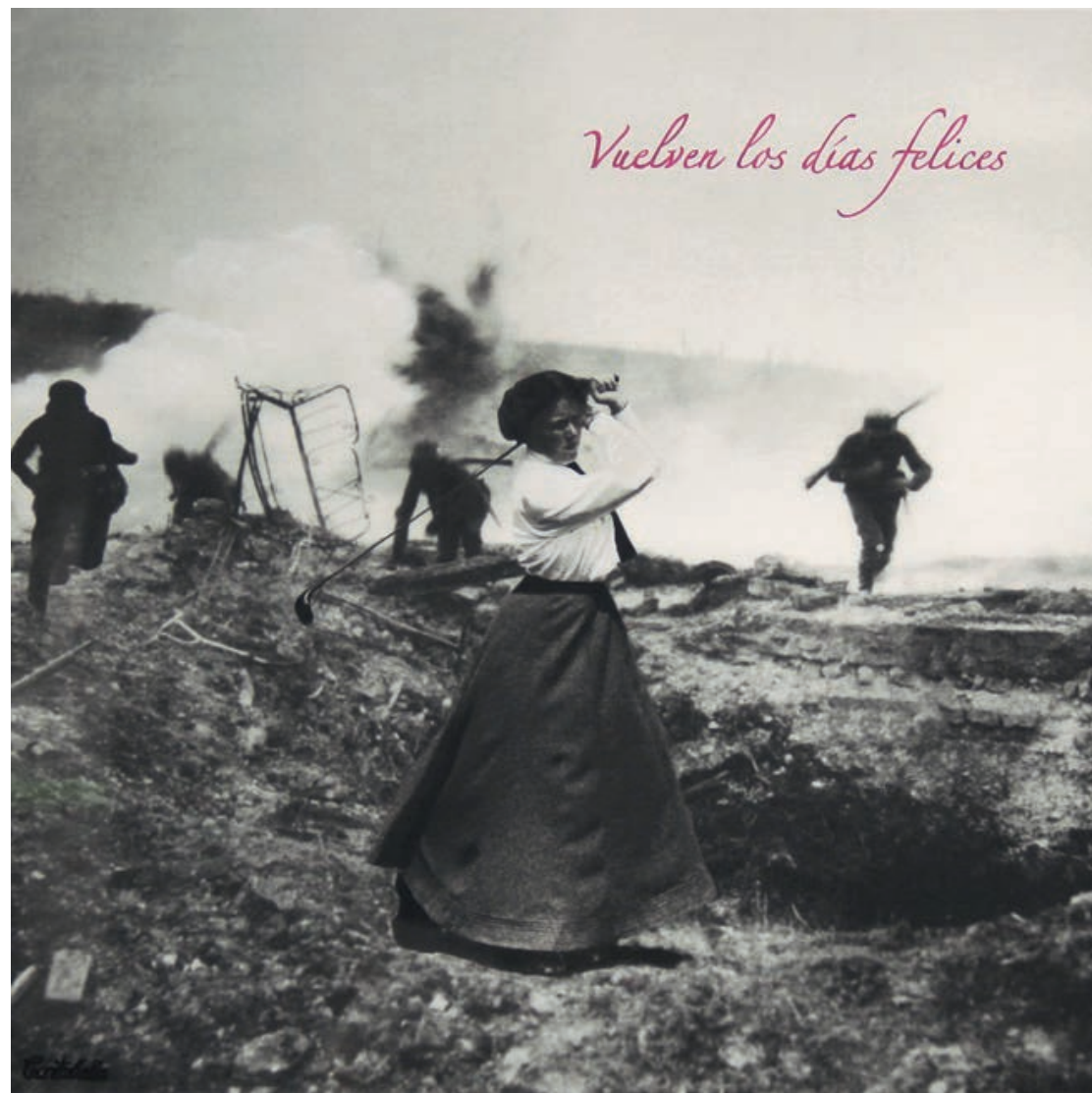
Vuelven los días felices Acrílico e impresión digital sobre lienzo 50 x 50 cm. 2019