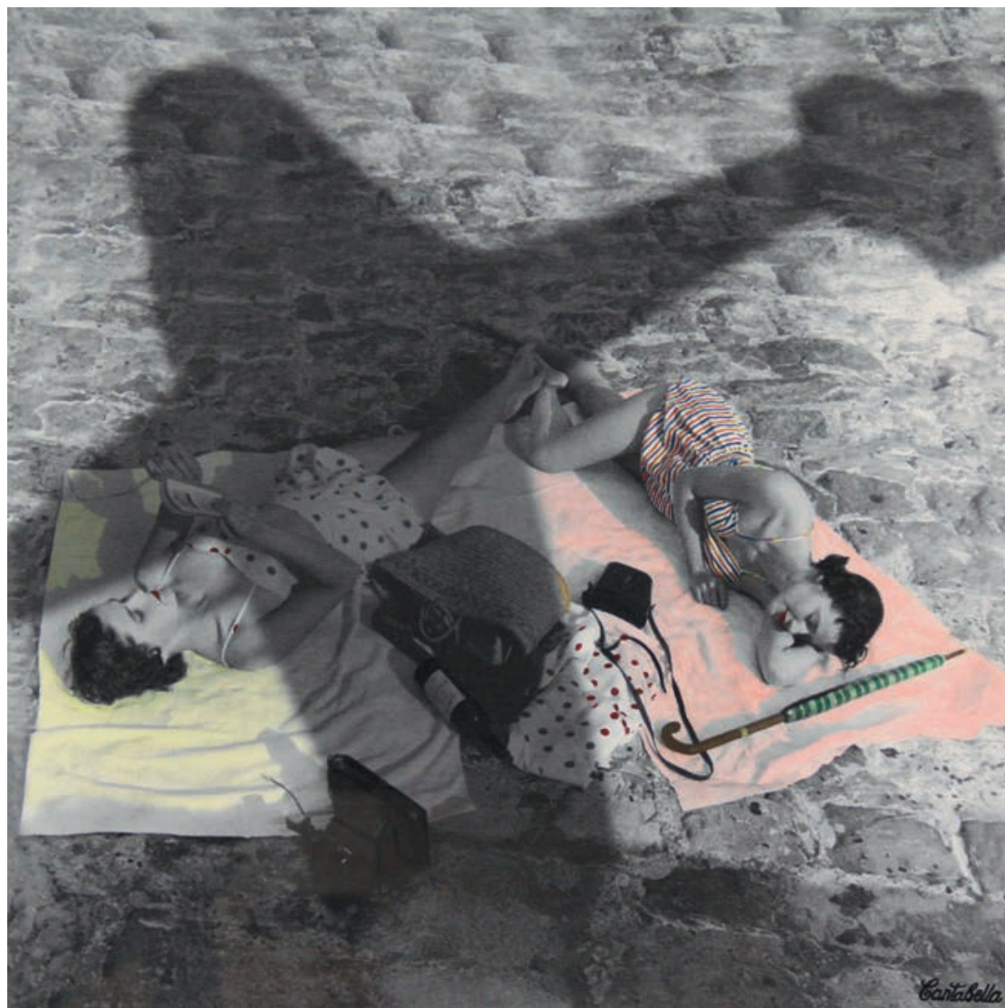
La sombra del ciprés Acrílico e impresión digital sobre lienzo 50 x 50 cm. 2019