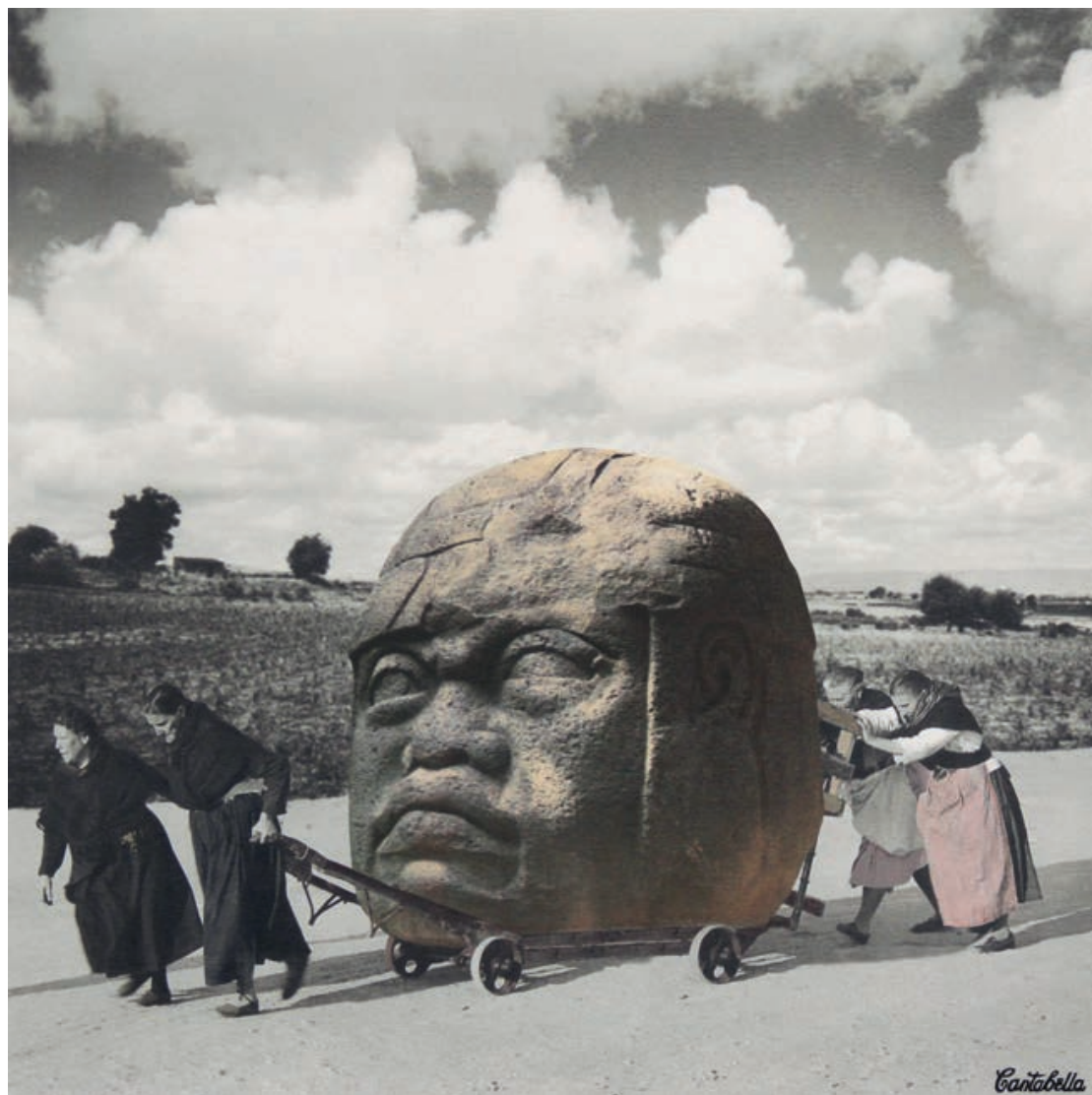
La memoria Acrílico e impresión digital sobre lienzo 50 x 50 cm. 2019