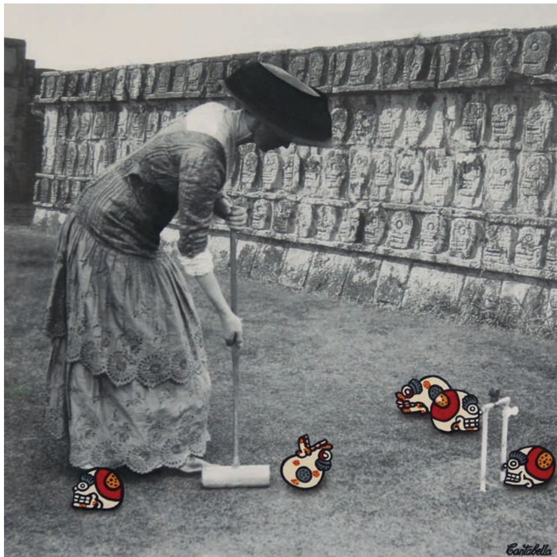
Juego de pelotas Acrílico e impresión digital sobre lienzo 50 x 50 cm. 2019