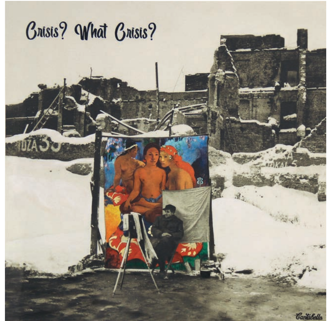
Crisis? What crisis?. (Fotógrafo) Acrílico e impresión digital sobre lienzo 50 x 50 cm. 2019