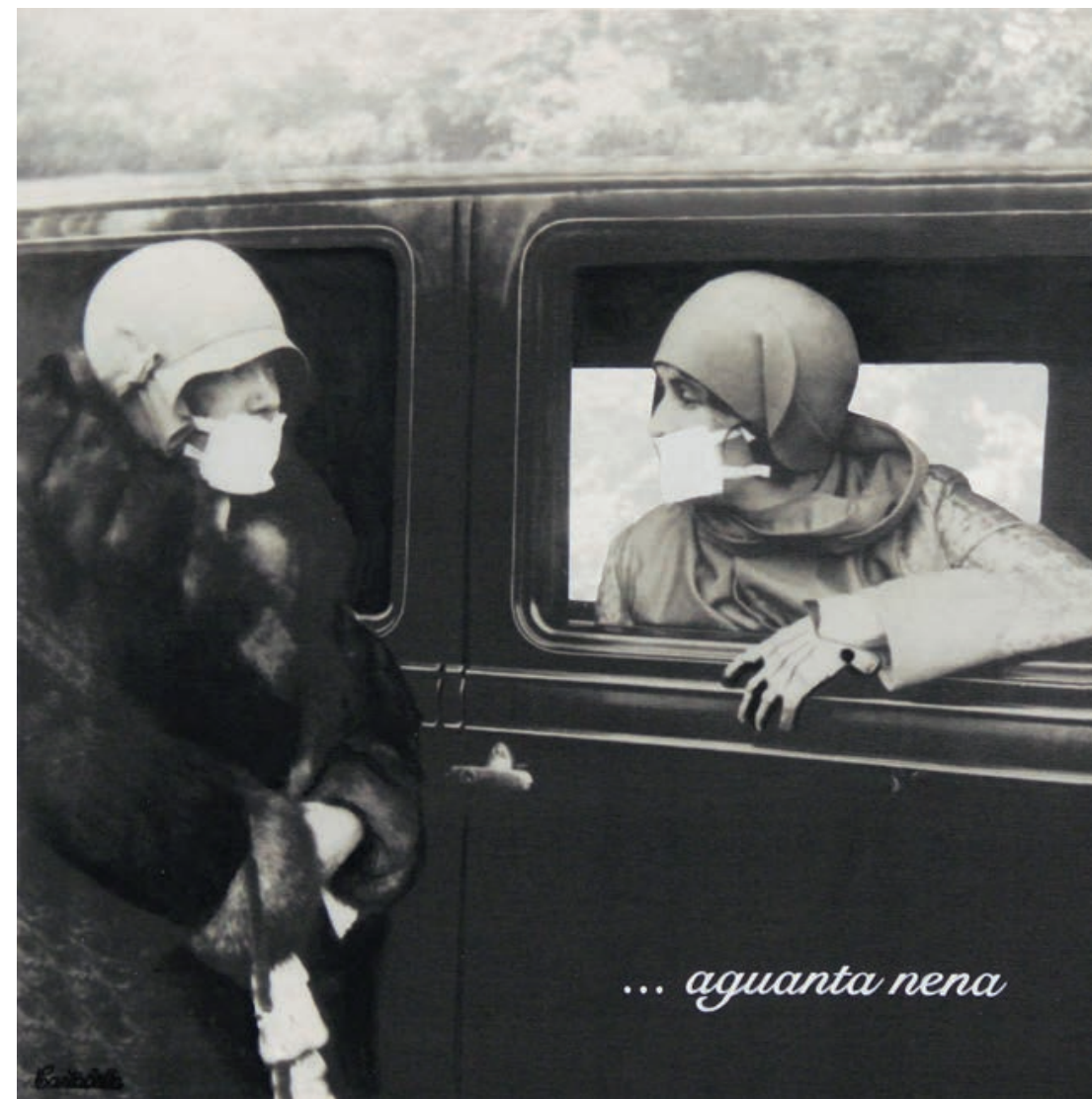
Aguanta nena Acrílico e impresión digital sobre lienzo 50 x 50 cm. 2019