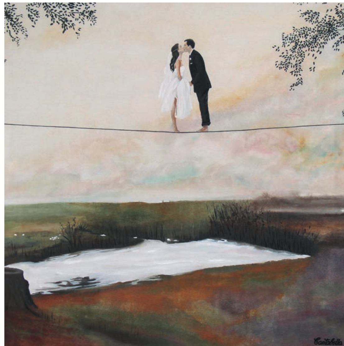
Lovers Acrílico e impresión digital sobre lienzo 50 x 50 cm. 2019