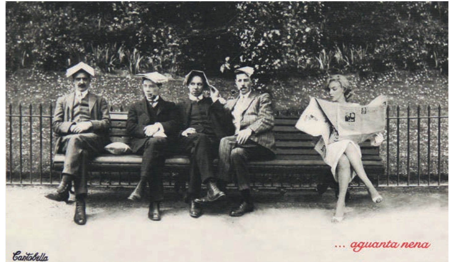
Aguanta nena. (Marilyn) Acrílico e impresión digital sobre lienzo 50 x 50 cm. 2019