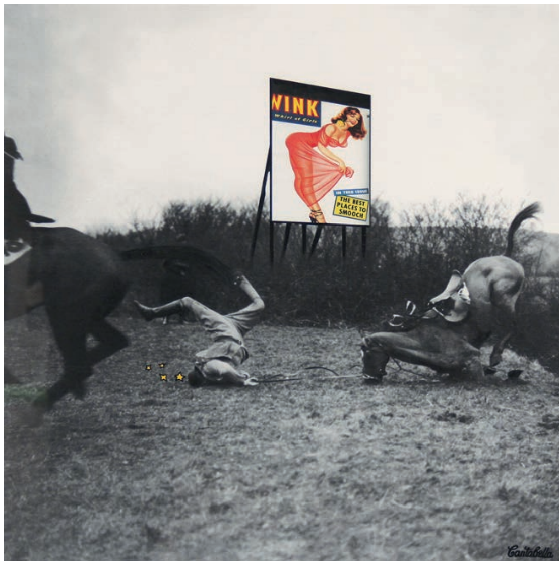
All you need is pop. (Jinete) Acrílico e impresión digital sobre lienzo 50 x 50 cm. 2019