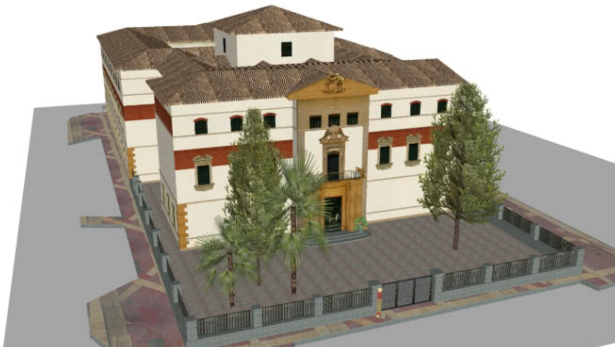
Imagen del Museo Arqueológico de Murcia (MAM) donde celebraremos la final.

https://docs.google.com/forms/d/e/1FAIpQLSeNtXW85Dxr07hq5eHAGu-e-oeEfej4hRP9cWynu_JPiJShxg/viewform?usp=sf_link