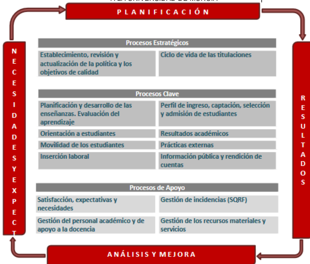
Figura 1. Mapa de Procesos del Sistema Aseguramiento Interno de Calidad.

ISEN CENTRO UNIVERSITARIO, FACULTAD ADSCRITA A LA UNIVERSIDAD DE MURCIA