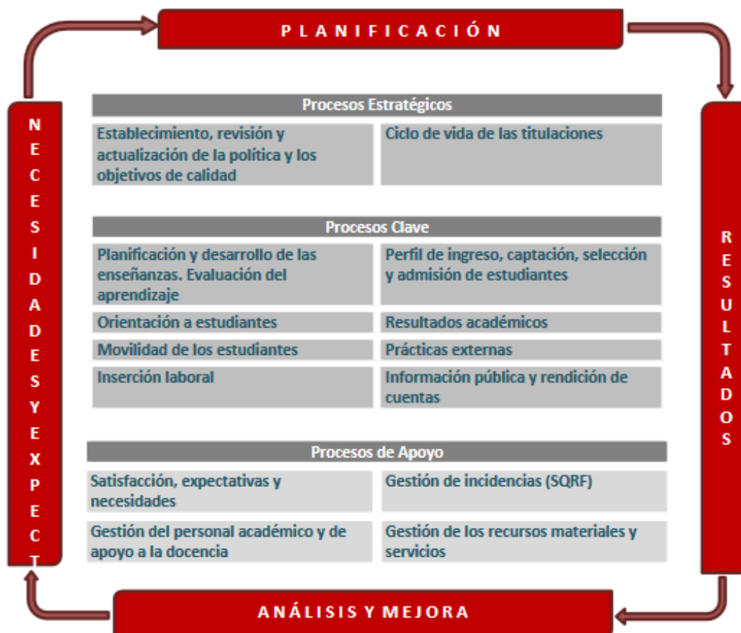
Figura 1. Mapa de Procesos del Sistema Aseguramiento Interno de Calidad.

El Programa de Orientación y Tutoría, en el caso de los Grados de la Facultad de Educación, consta de: