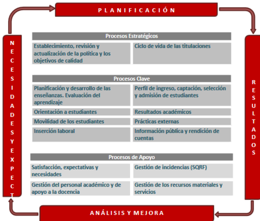
Figura 1. Mapa de Procesos del Sistema Aseguramiento Interno de Calidad.

El Programa de Orientación y Tutoría, en el caso de los Grados de la Facultad de Educación, consta de: