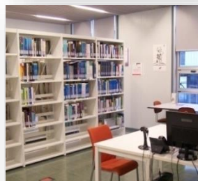
Biblioteca/Sala de estudio