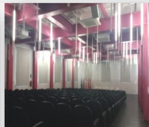
Salón de actos