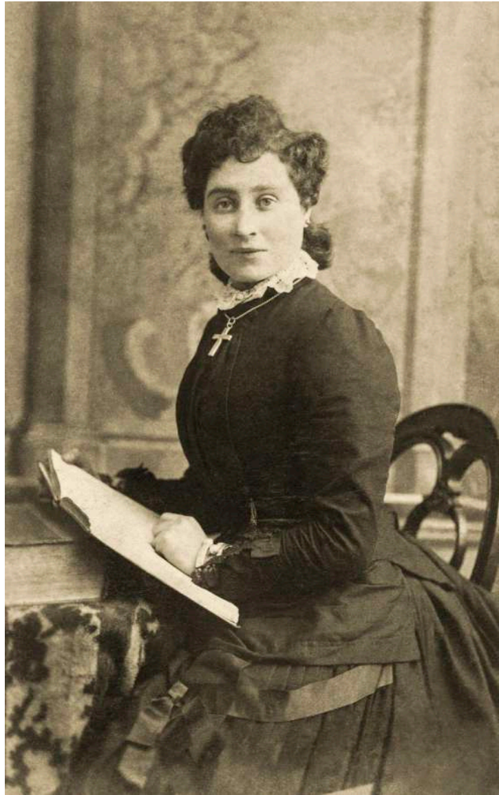
Retrato de dama leyendo W. Thomson. Aberdeen, Inglaterra. 1884