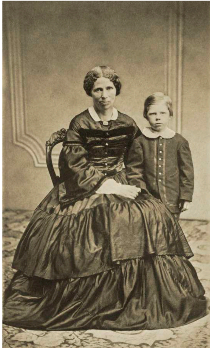
Retrato de madre e hijo Anónimo. Bryan, Ohio, Estados Unidos. 1865