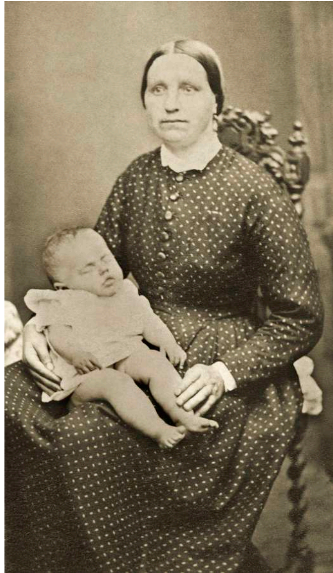
Retrato de madre con su hijo difunto P. Beal. Cambrai, Francia. 1879