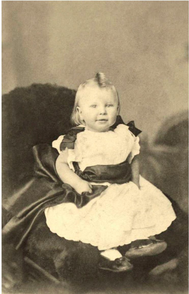
Retrato de niña sedente Chapman & Son. Dawlish, Inglaterra. 1890