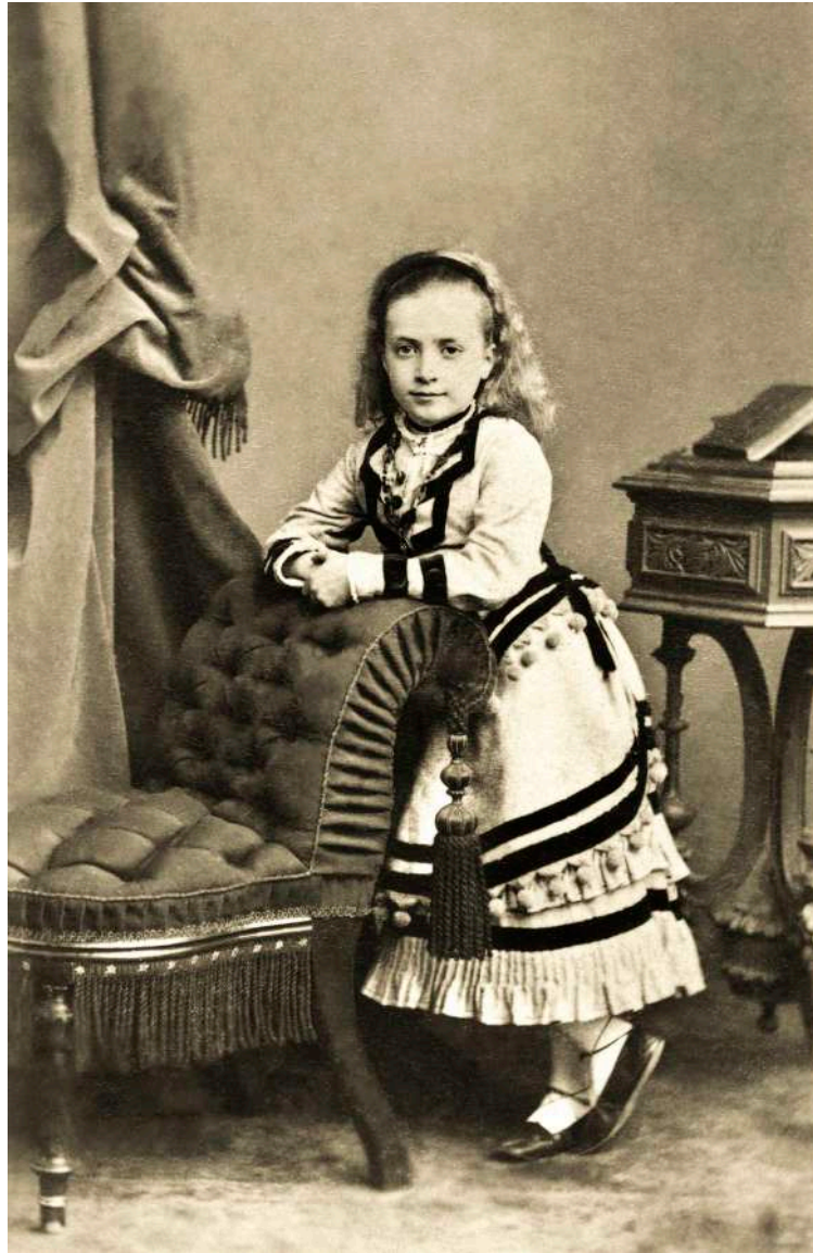
Retrato de niña con sillón de pose H. J. Whitlock. Birmingham, Inglaterra. 1875