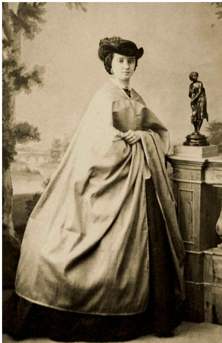
Retrato de dama sobre fondo de paisaje E. Godinez. Sevilla, España. 1867