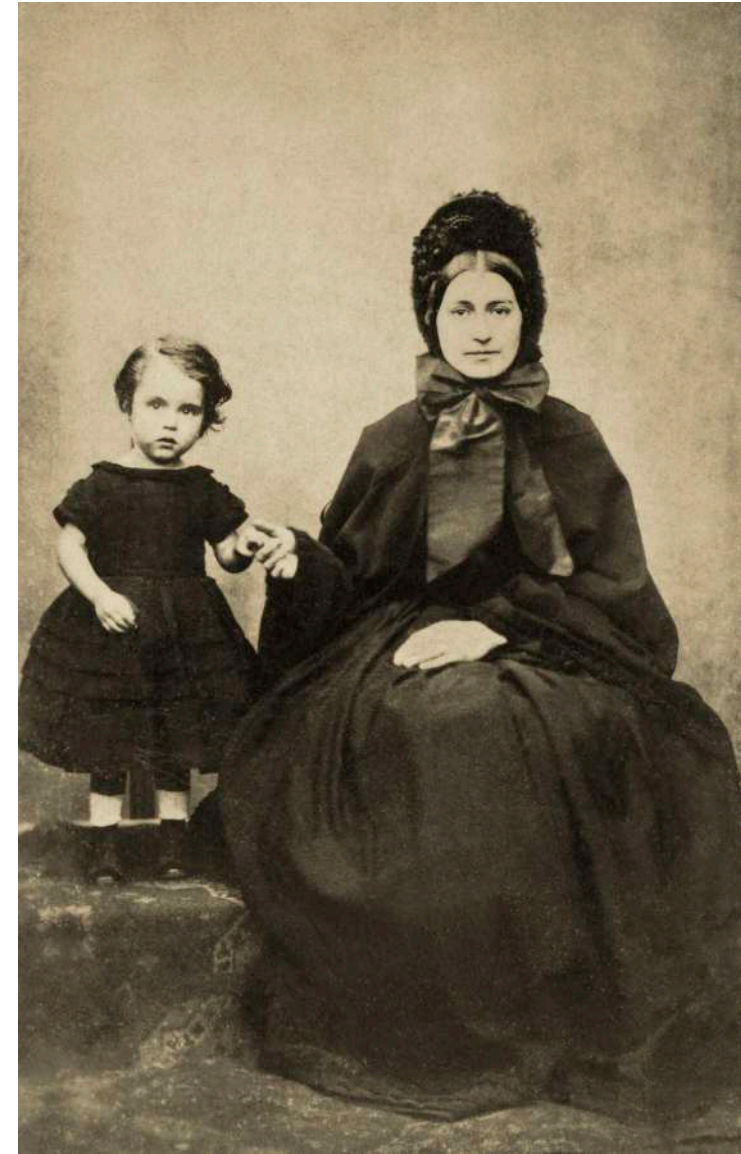
Retrato de viuda con su hija Anónimo. Mansfield, Ohio, Estados Unidos. 1871