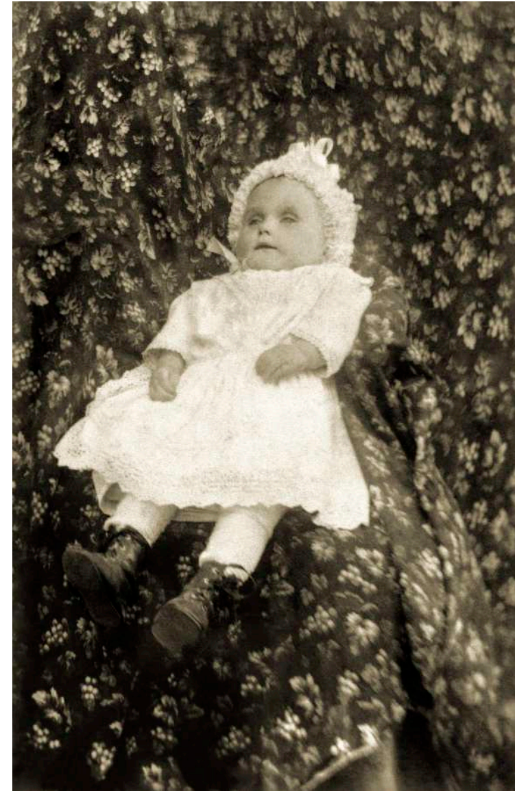
Retrato infantil post mortem F. Ricard. Avallon, Francia. 1898