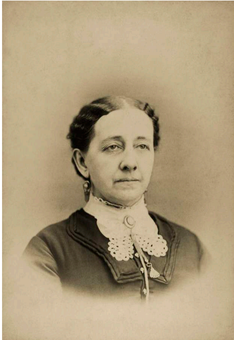
Retrato de dama de medio busto A. D. Harding. Pensilvania, Estados Unidos. 1892