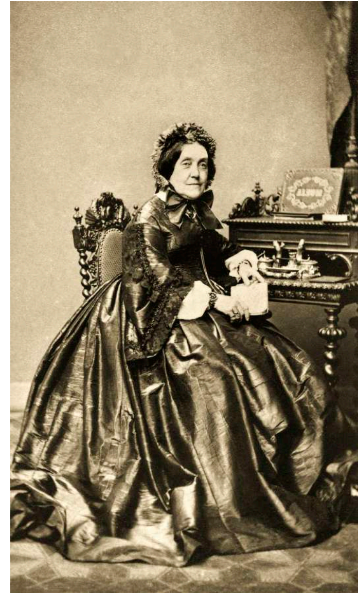
Retrato de anciana con un álbum familiar W. Breuning. Hamburgo, Alemania. 1868