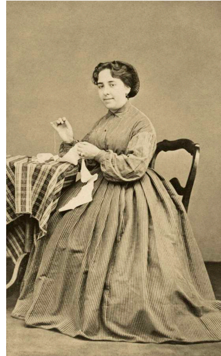
Retrato de dama cosiendo Anónimo. Madrid, España. 1889