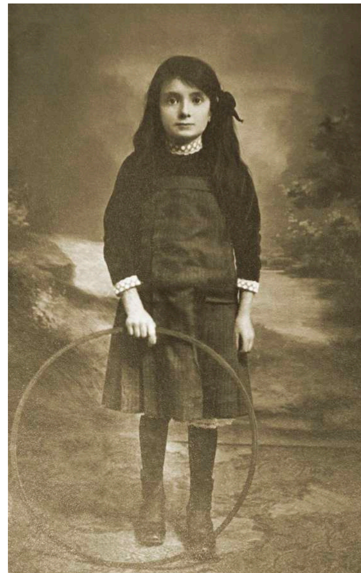
Retrato de niña con aro E. Bartoli. Lyon, Francia. 1899