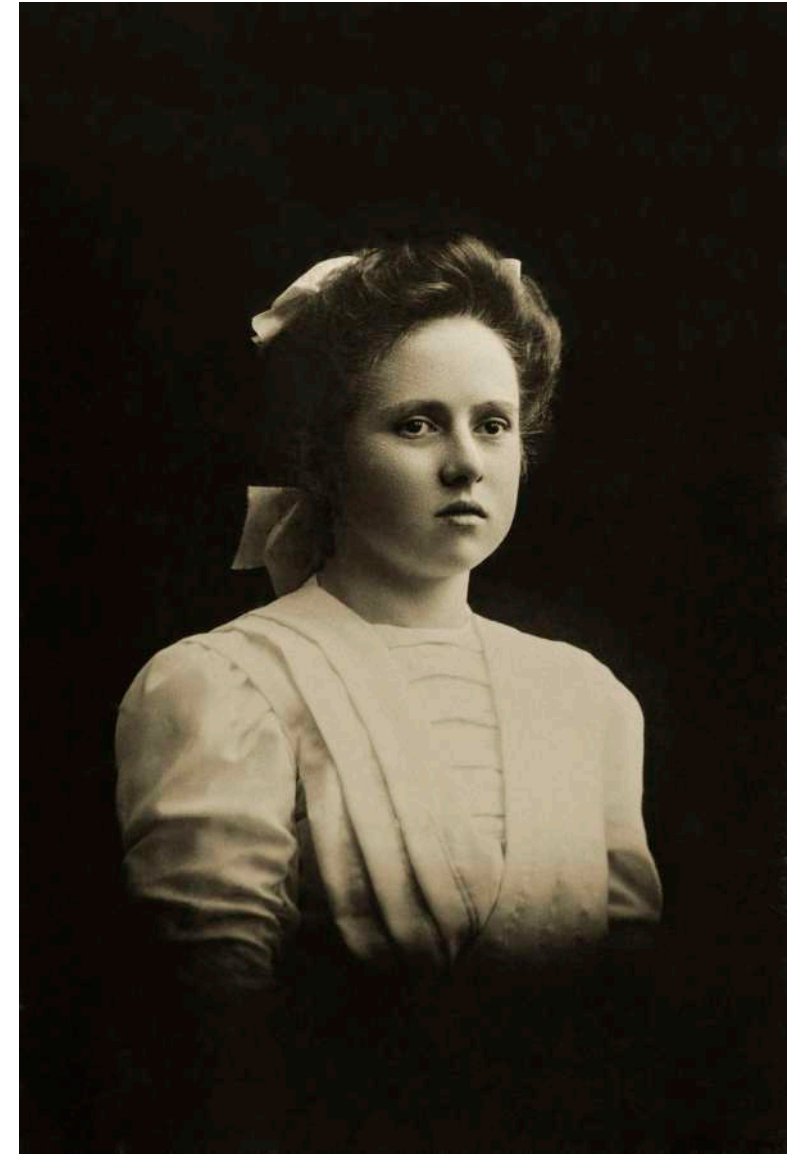
Retrato artístico Eurenus. Karlskrona, Suecia. 1899