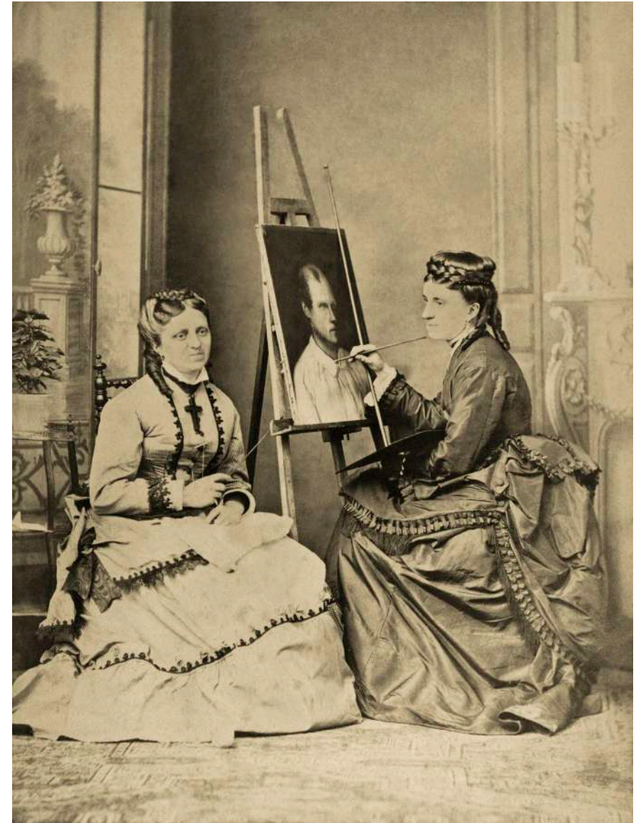
Retrato de damas pintando A. Mallart. Amiens, Francia. 1878