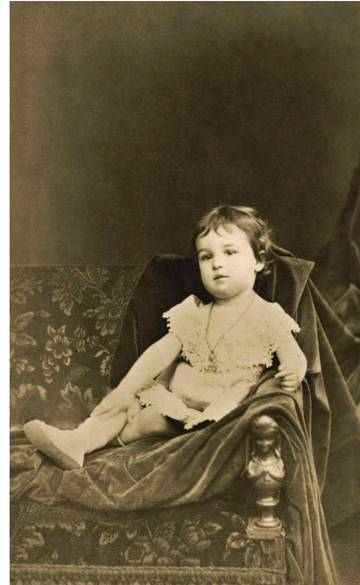
Retrato de niña con decorado de terciopelo Truchelut. París, Francia. 1885