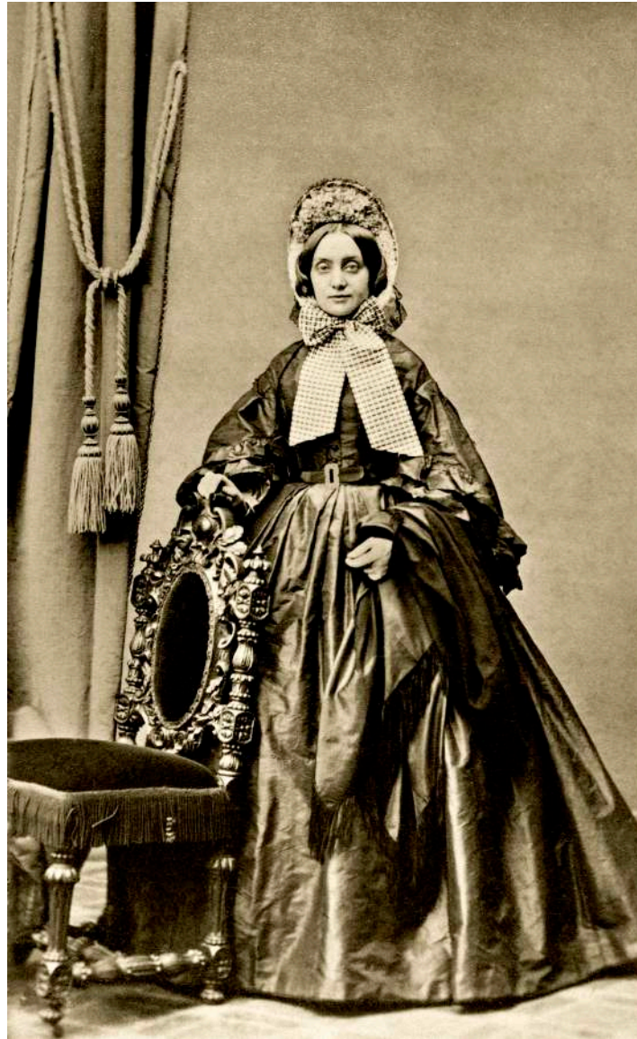
Retrato de dama con capota E. Bieber. Hamburgo, Alemania. 1869