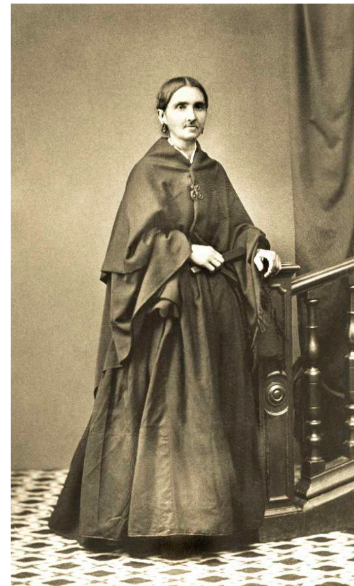
Retrato de anciana de luto J. Gutiérrez. Madrid, España. 1865