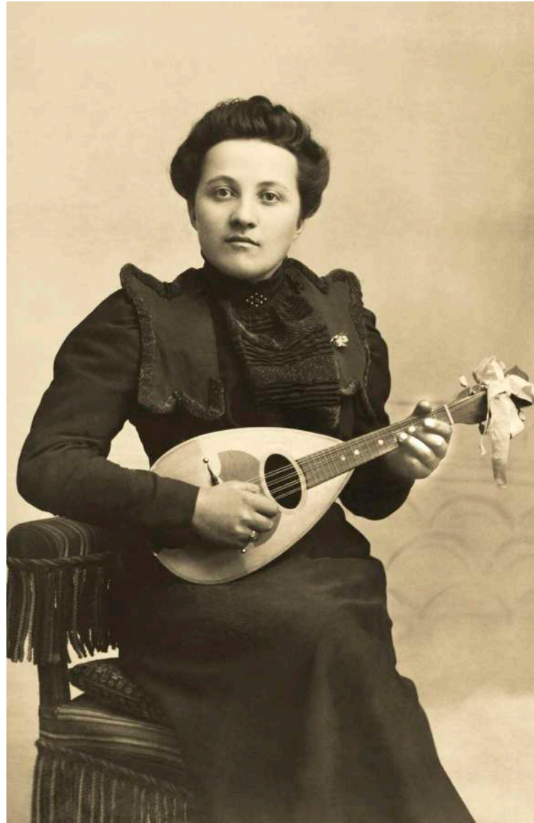
Retrato de mujer con mandolina A. Mounier. Gap, Francia. 1899