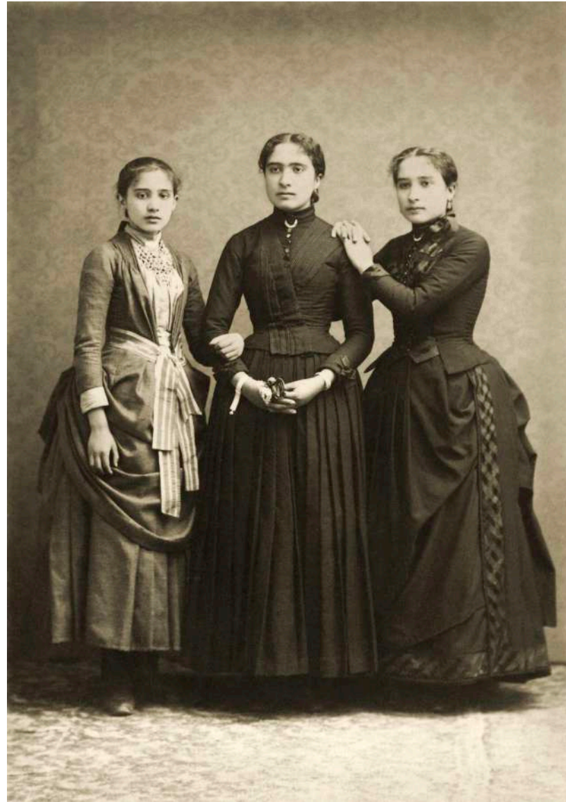
Retrato de tres hermanas D. Bosch. Figueras, España. 1899