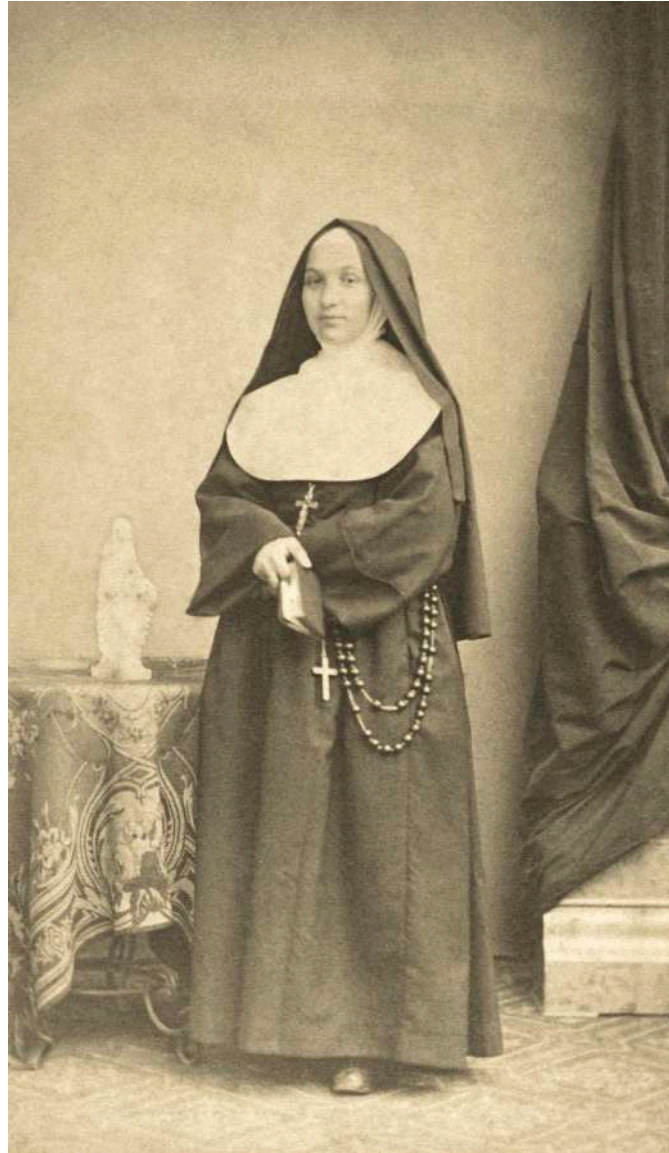
Retrato de monja L. Chamussy. Chambéry, Francia. 1883