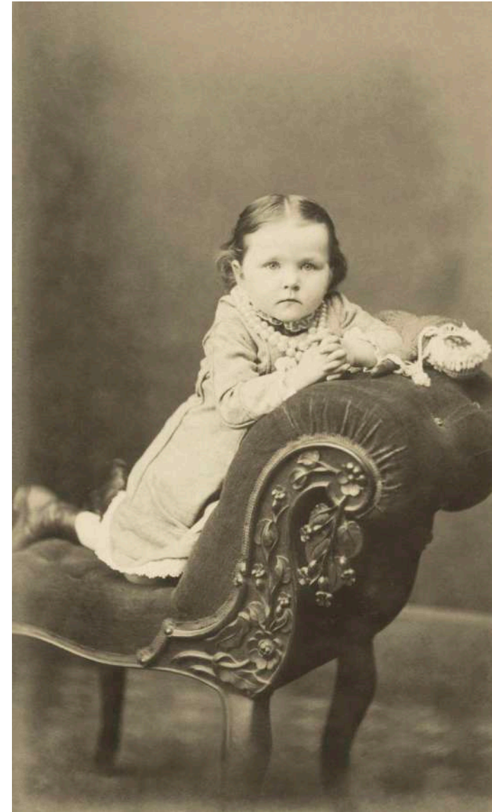
Retrato de niña sobre diván W. H. Gill. Devonport, Australia. 1896