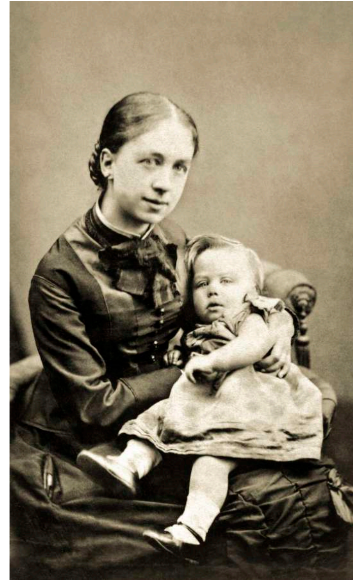
Retrato de madre con hijo The London Stereoscopic & Photographic Company. Londres, Inglaterra. 1882