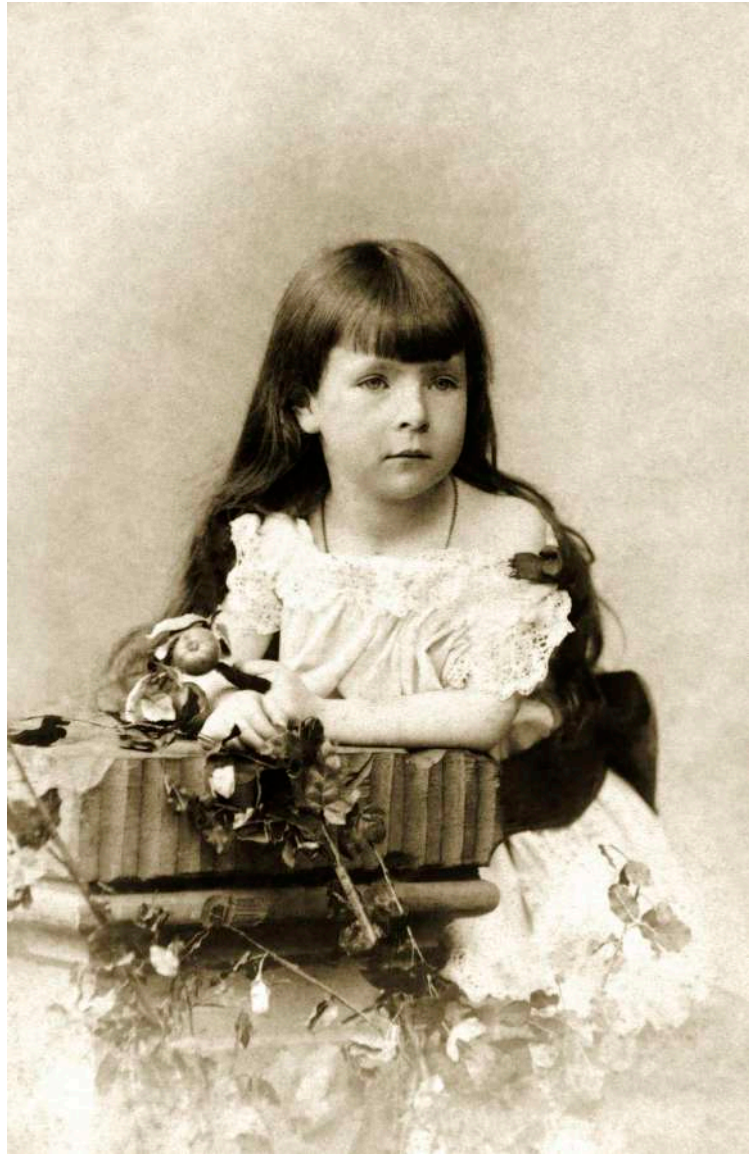
Retrato de niña con motivos vegetales C. Ruf. Mannheim, Alemania. 1893