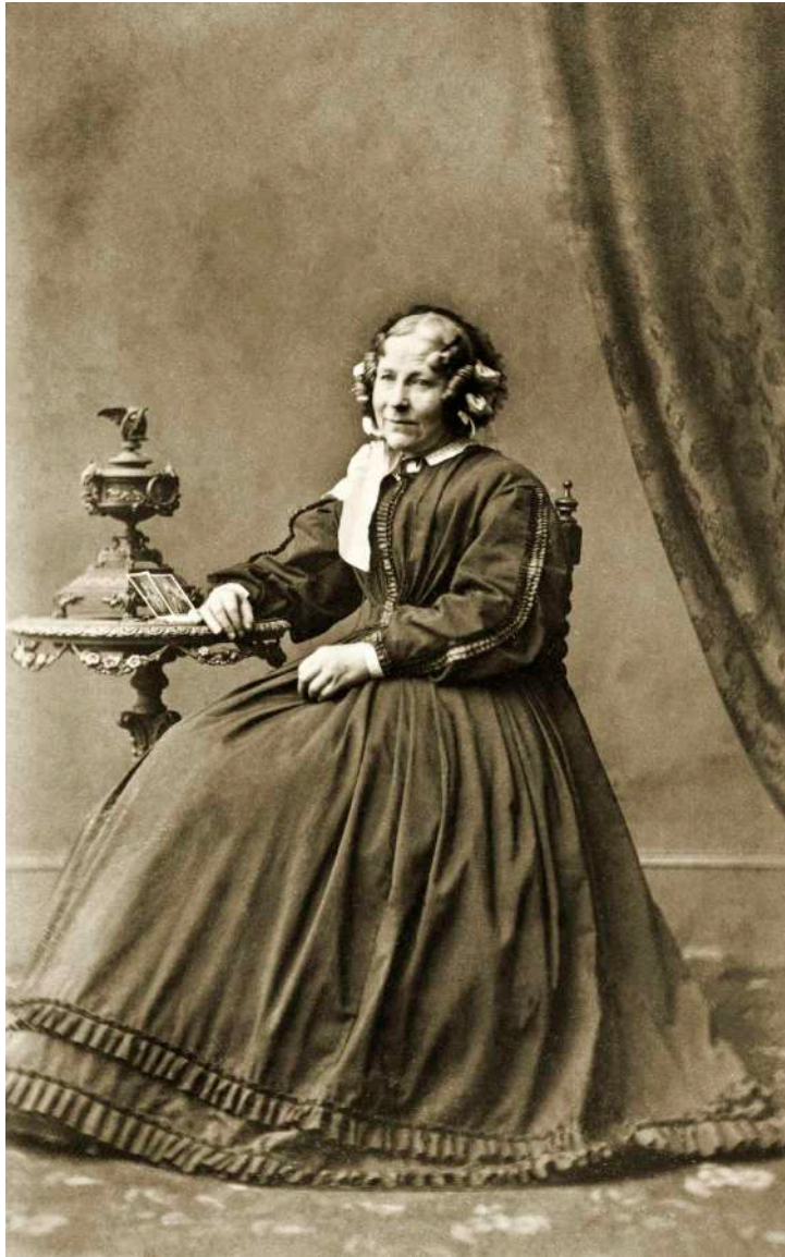
Retrato de anciana posando con fotografías Turner & Everitt. Londres, Inglaterra. 1875