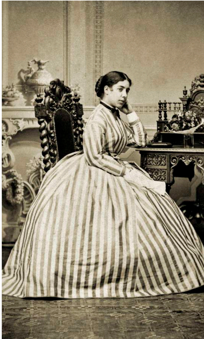
Retrato de joven sedente F. Hertel. Weimar, Alemania. 1872