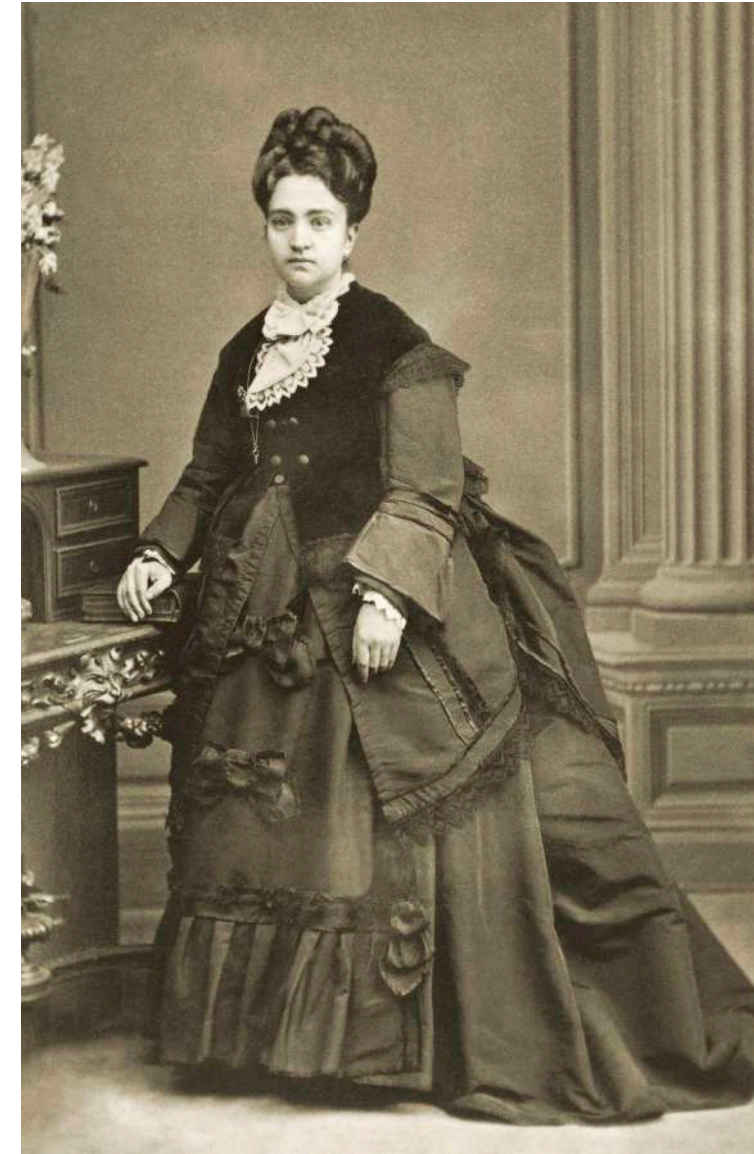
Retrato de dama apoyada sobre un buró E. Otero. Madrid, España. 1874