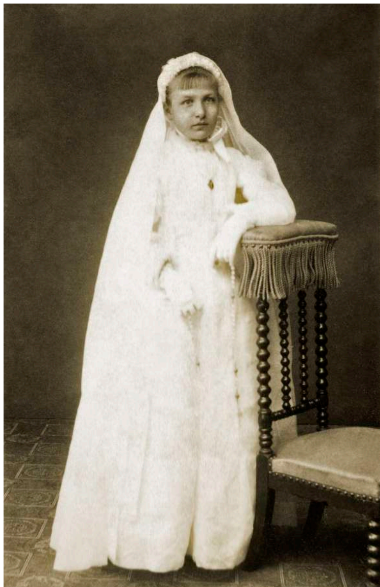
Retrato de niña de comunión J. F. Lepruiner. Bayeux, Francia. 1882