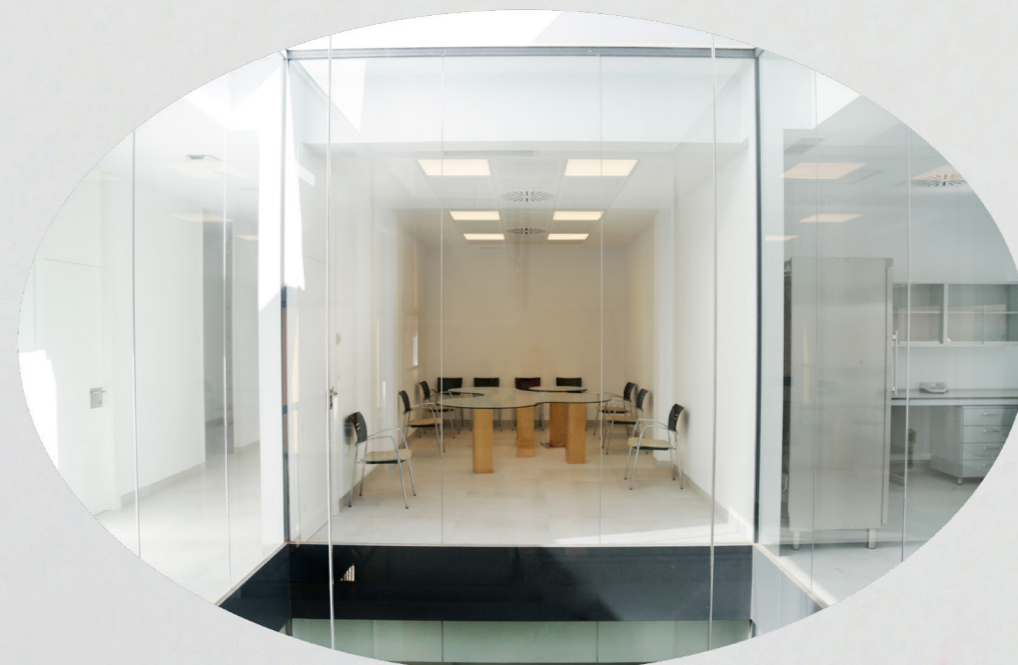
Sala de juntas y laboratorio del Centro de Formación, Investigación y Atención Sociosanitaria, Fundación Poncemar / Lorca 2023