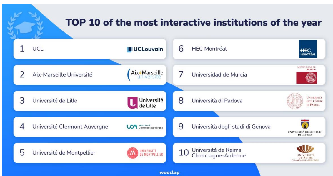
Figura 4. The Top 10 most interactive institutions globally! (Wooclap, 2022b)