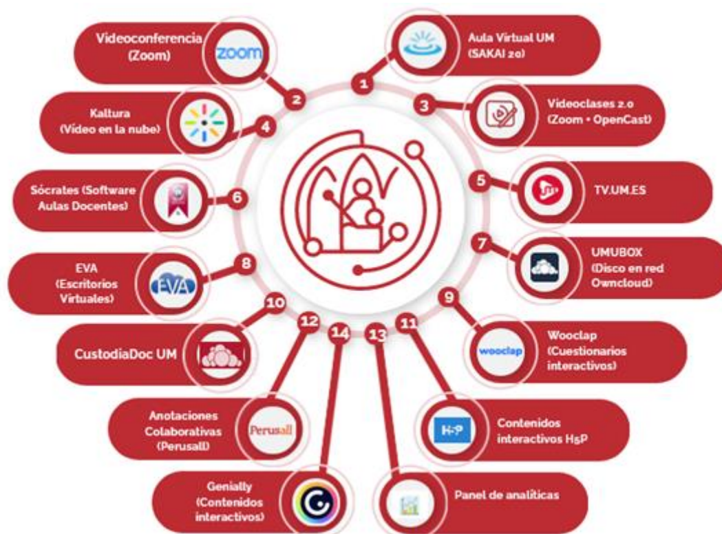
Figura 1. Ecosistema TIC de la UM para docencia.

De estas herramientas, Videoclases ofrece la realización de videoconferencias para impartir clases online y grabar dichas clases, la herramienta de galería multimedia facilita los vídeos generados por el profesorado e incluirles elementos interactivos, la herramienta de Cuestionarios interactivos basada en Wooclap, y la herramienta de Anotaciones colaborativas basada en Perusal. También, en base a la información recopilada, se ha creado la herramienta Panel de analíticas , para realizar el seguimiento de la asistencia del alumnado tanto a sesiones presenciales como a las sesiones de videoclases, y el grado de realización de tareas y exámenes del alumnado. Por tanto, el AV permite la realización de distintas actividades de enseñanza y aprendizaje, de comunicación, colaboración y coordinación.