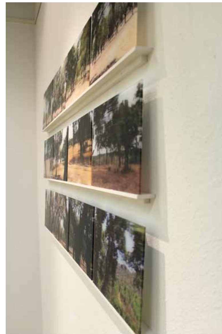
Auto-estrada Impresión / Acrílico 20 x 30 cm (c.u. x 12) 2020