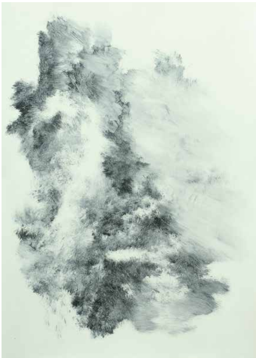
Cinzento I Óleo / papel Fabriano 69'5 x 49'9 cm. 2020