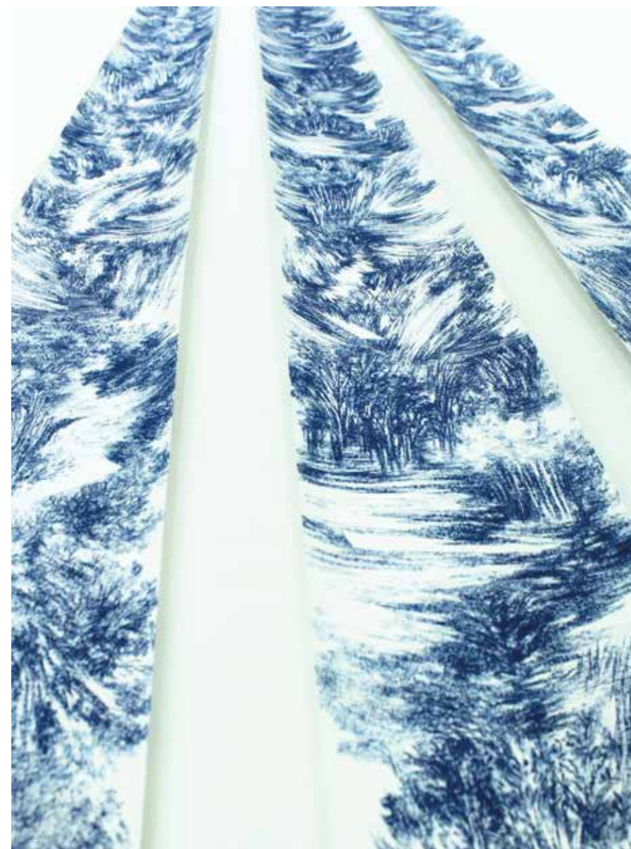
Estreito Pigmento prensado / papel Fabriano 300 x 23 cm. 2020