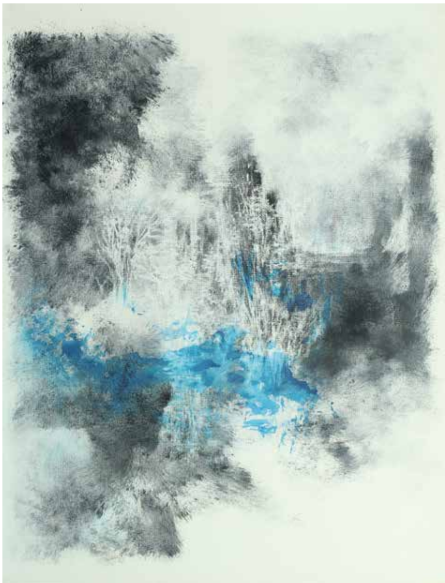
Vestígios de um lago I Óleo, ecoline y pigmento prensado / lienzo 56'5 x 43'5 cm 2020