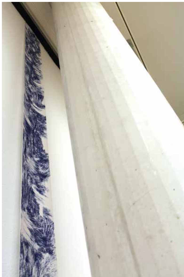
Estreito Pigmento prensado / papel Fabriano 300 x 23 cm. 2020