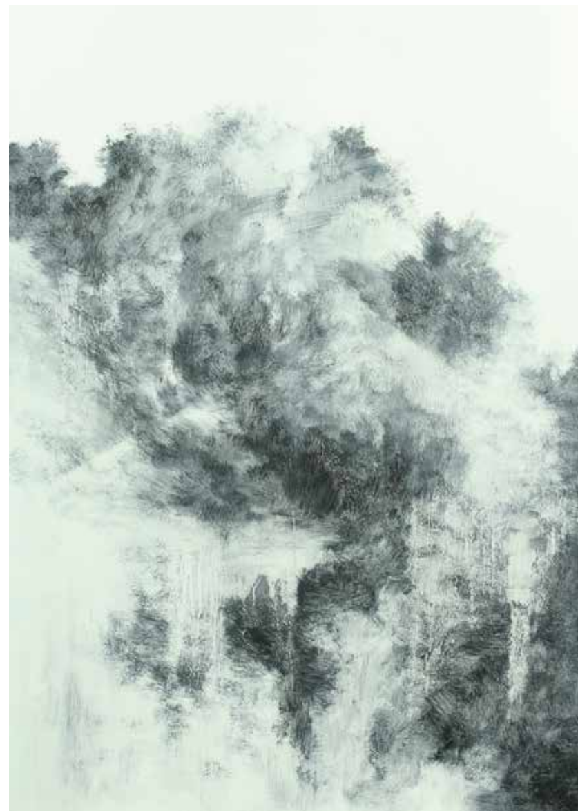
Cinzento II Óleo / papel Fabriano 69'5 x 49'9 cm. 2020