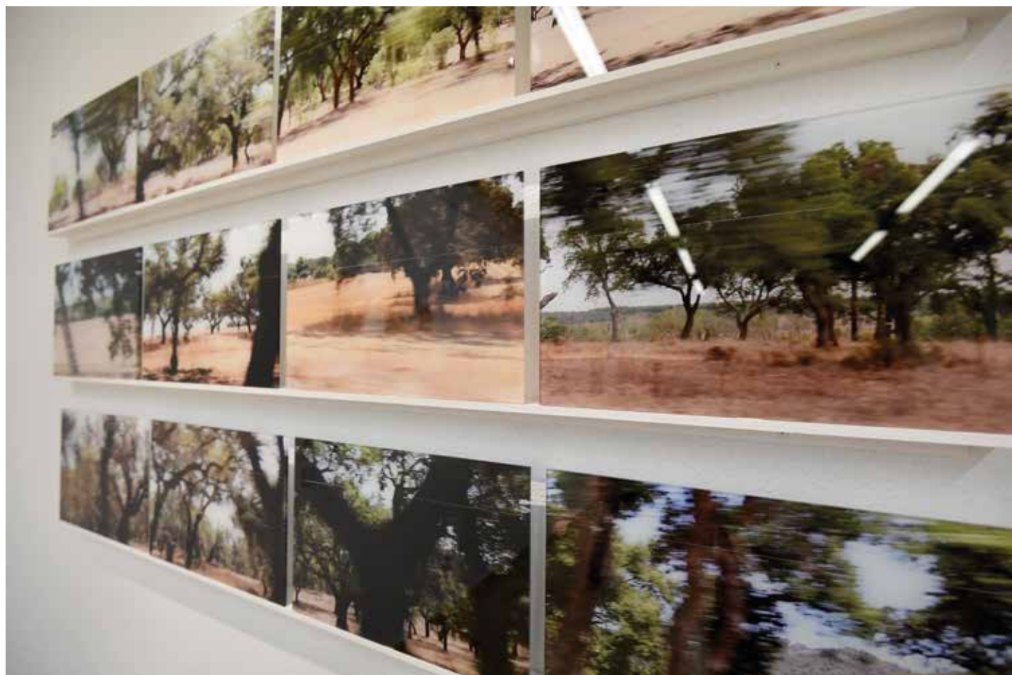
Auto-estrada Impresión / Acrílico 20 x 30 cm (c.u. x 12) 2020