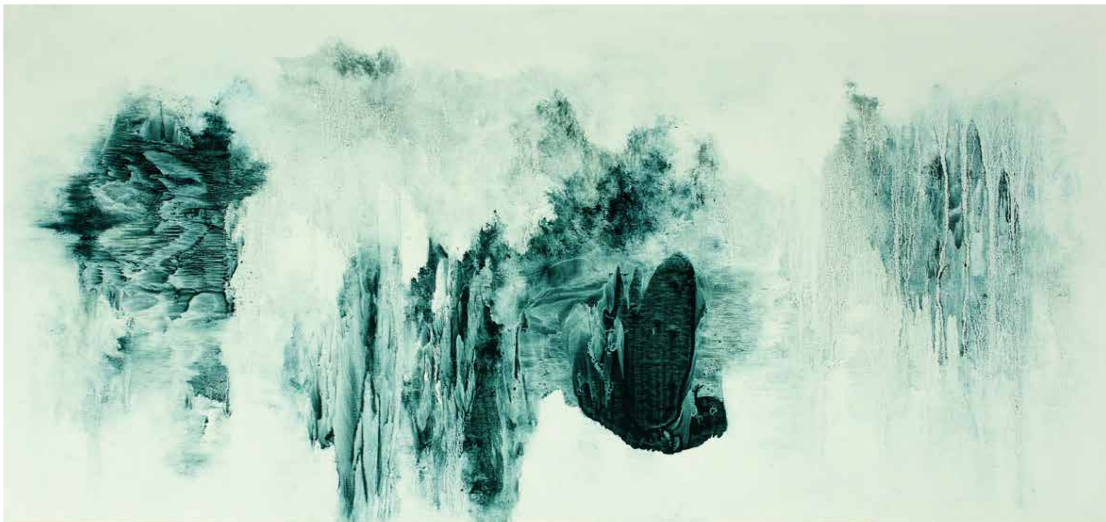
Paisagem líquida II Óleo / Lienzo 35 x 74 cm. 2020