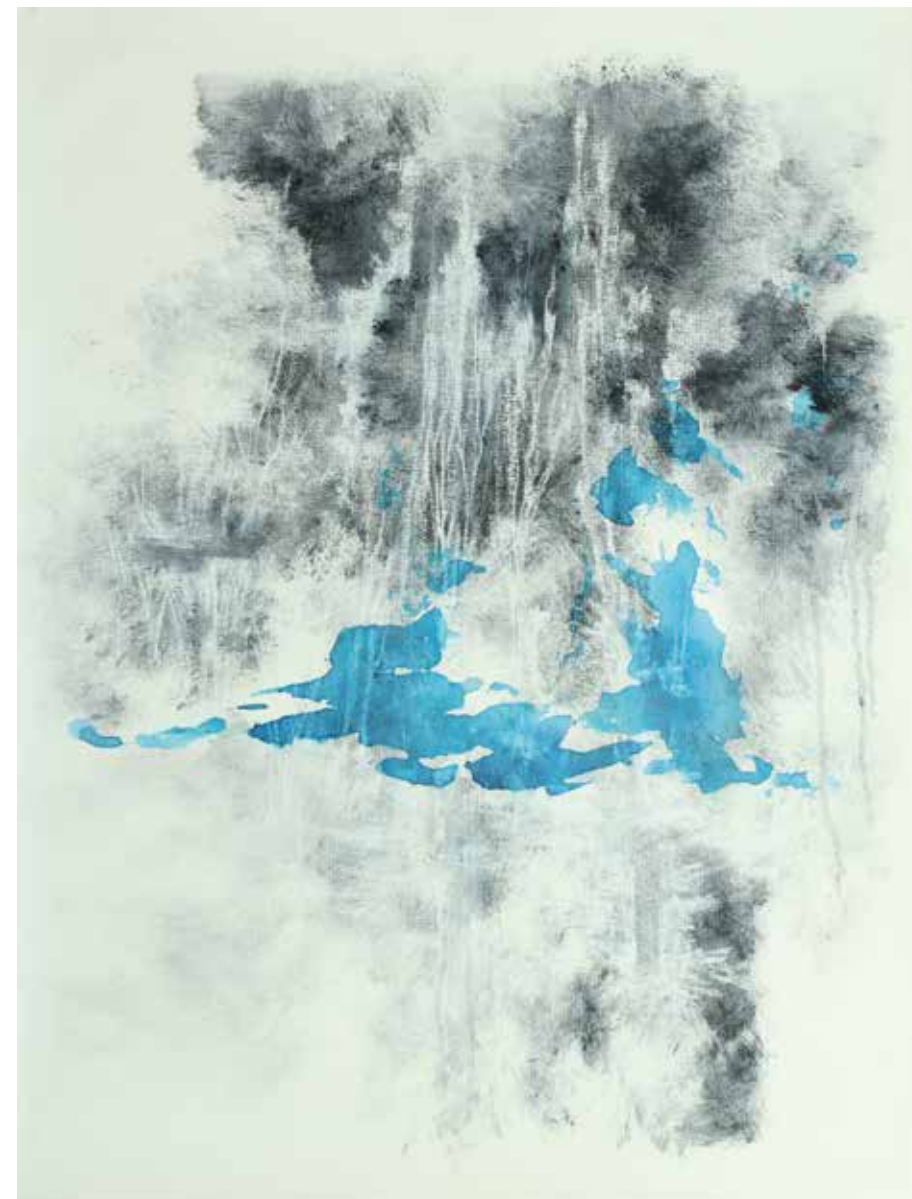
Vestígios de um lago II Óleo, ecoline y pigmento prensado / lienzo 56'5 x 43'5 cm 2020