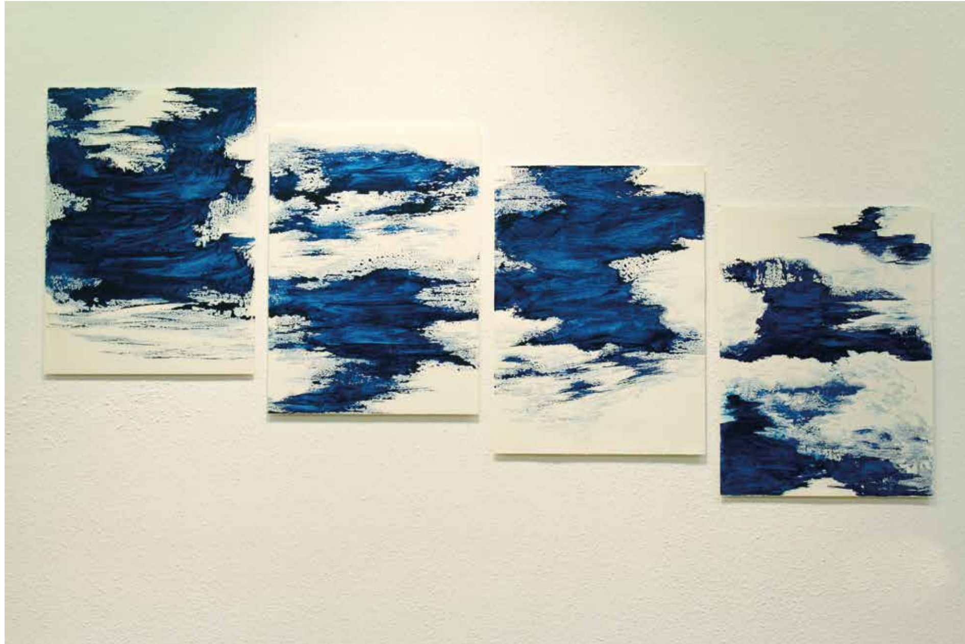
Azul líquido (I, II, III y IV) Acrílico / papel Canson 40'7 x 29'7 cm 2020