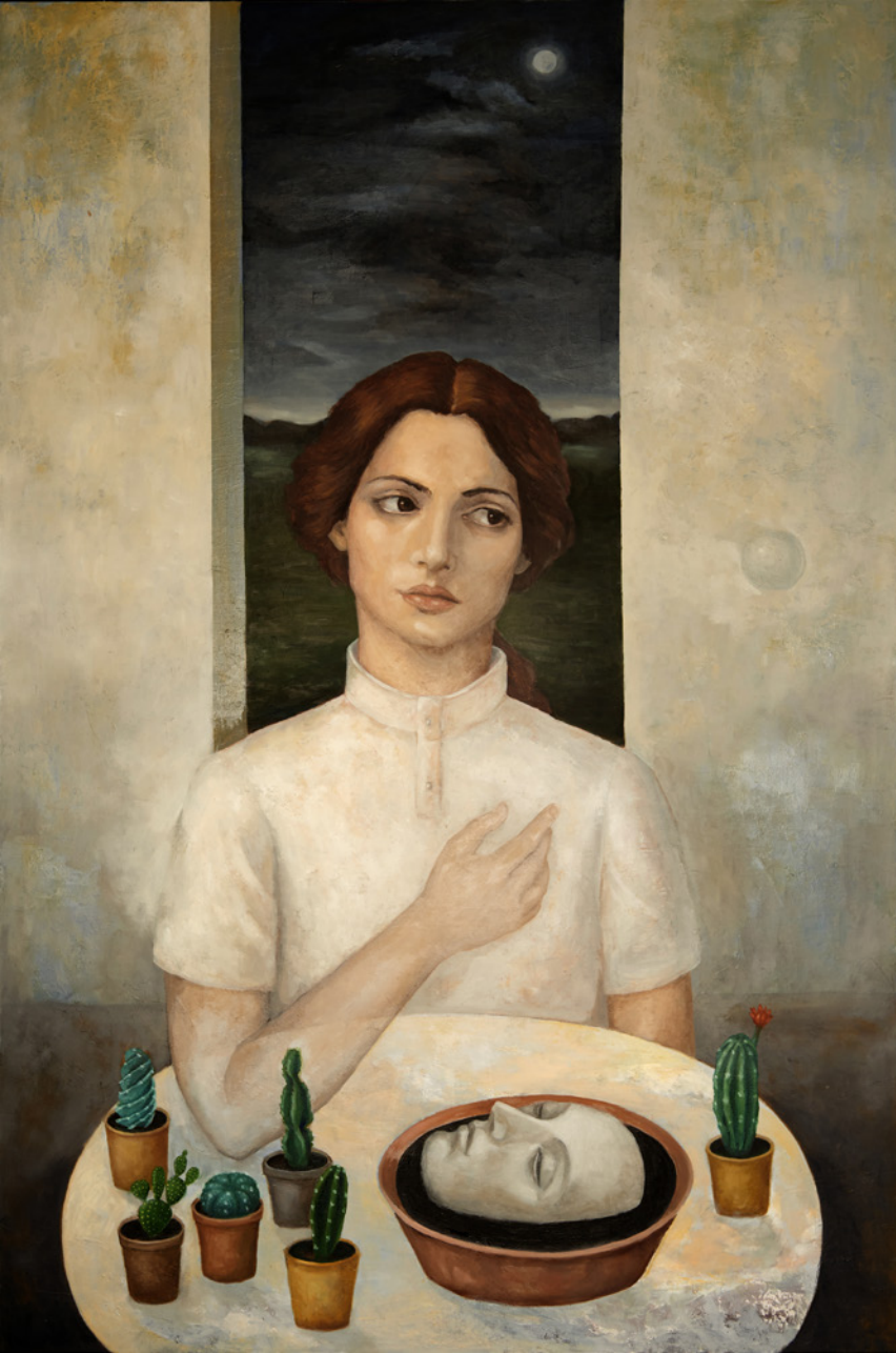
El ángel que custodia las espinas Óleo/tabla 126 x 84 cm.