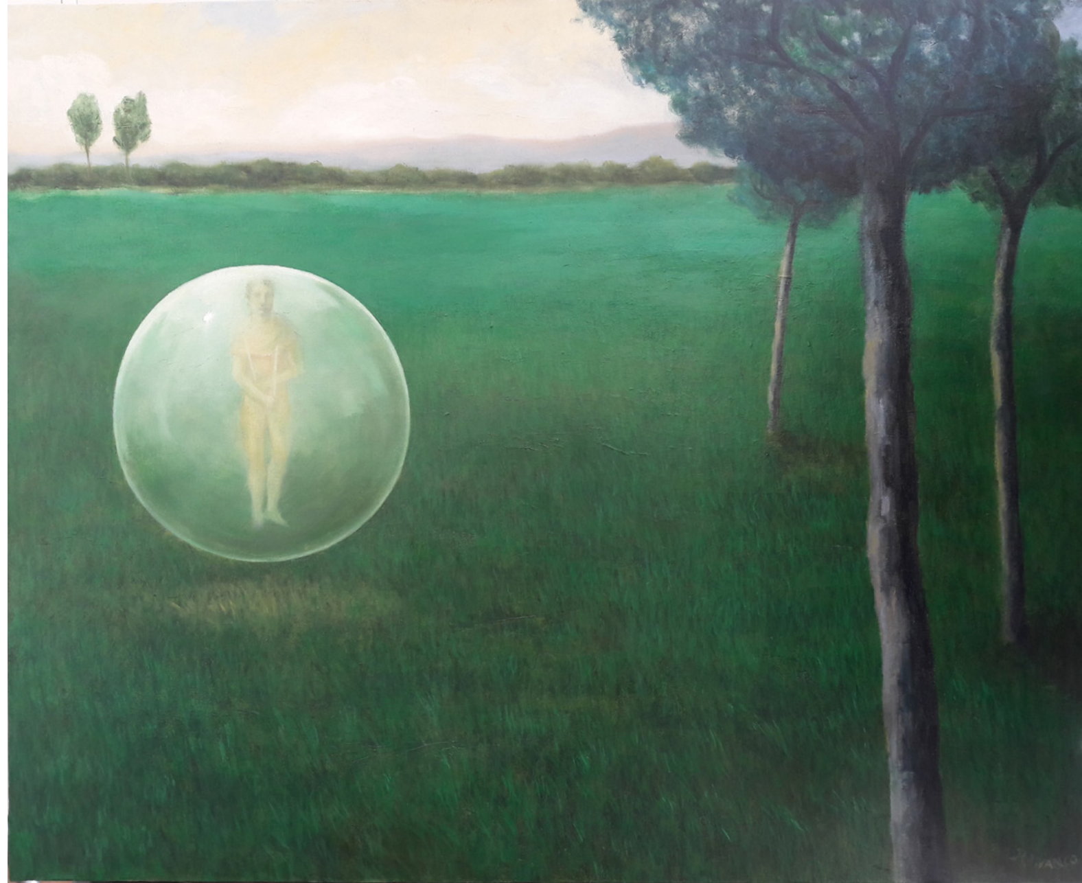
Huellas estelares II Óleo/tabla 60 x 73 cm.