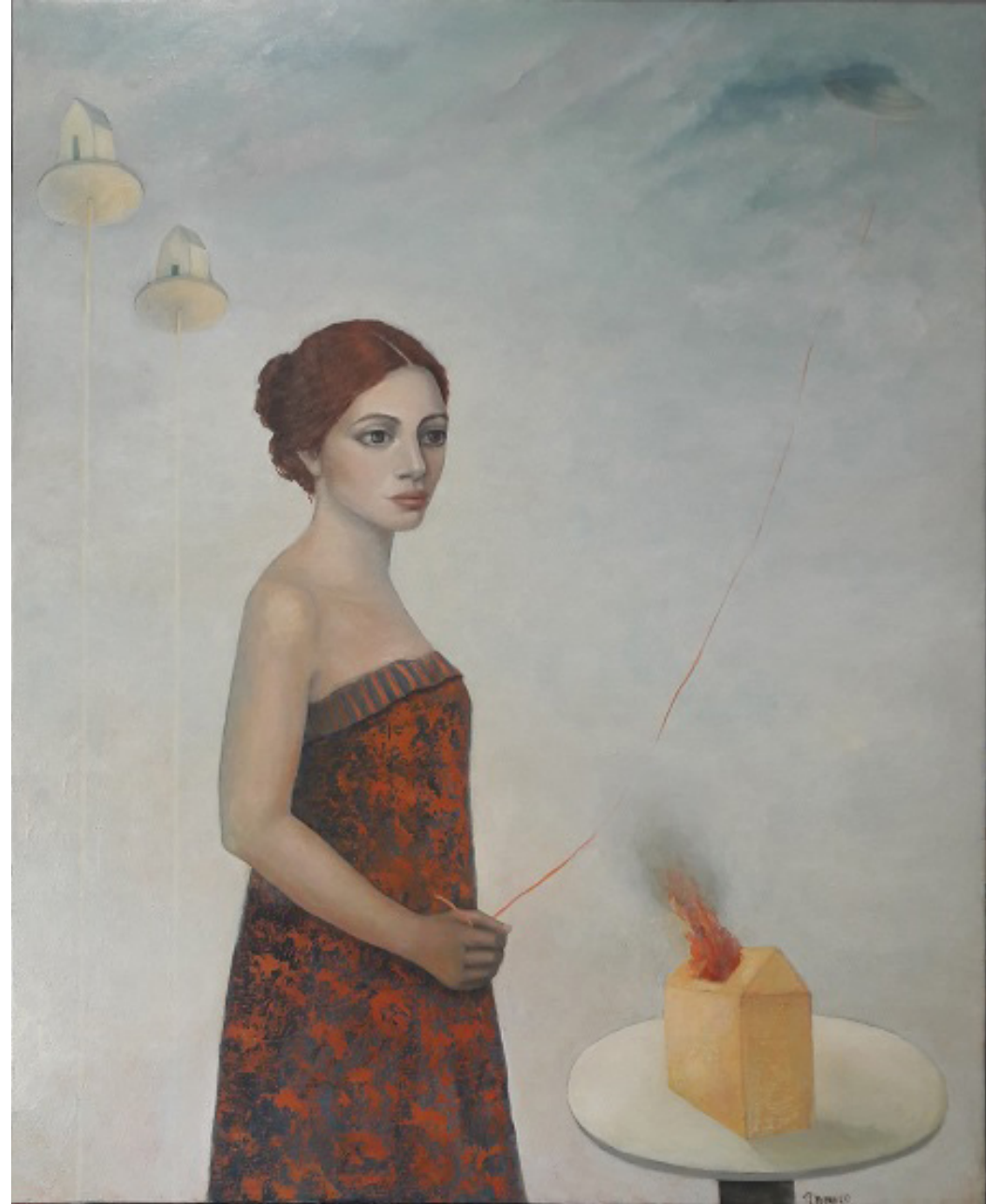
La casa del corazón de fuego Óleo/tabla 100 x 80 cm.