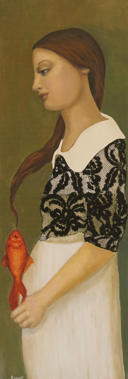
Ascuá marina Óleo/tela 72 x 23,5 cm.