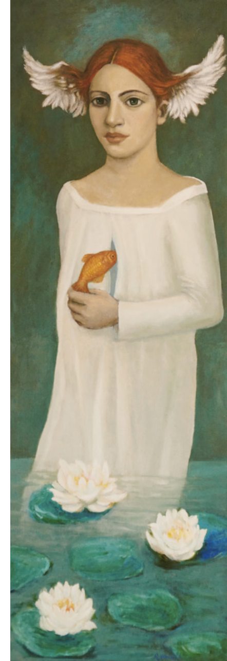
De la caverna azul se alzan las alas Impresión Dig.l 78 x 26,5 cm.