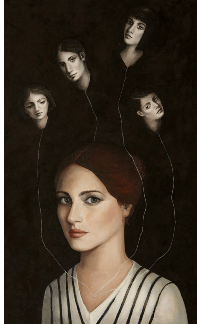
Opus Nigrum Óleo/tabla 70 x 42 cm.