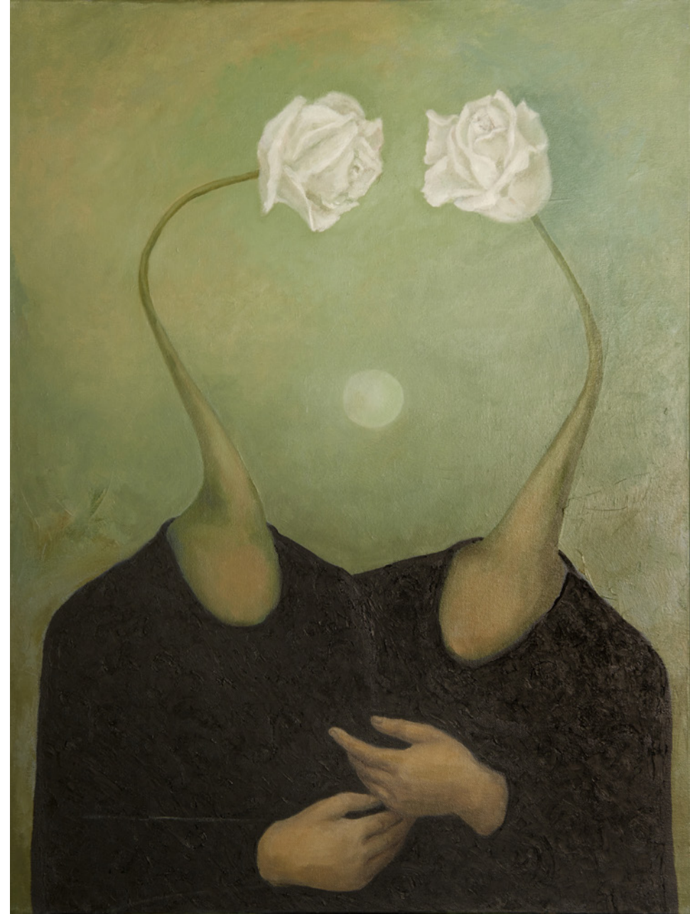
Confidencias Óleo/tabla 80 x 80 cm.