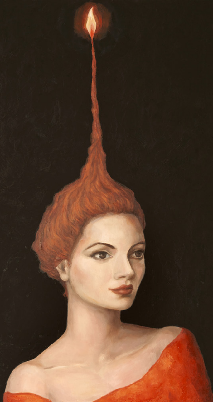
La llama Óleo/tabla 70 x 42 cm.