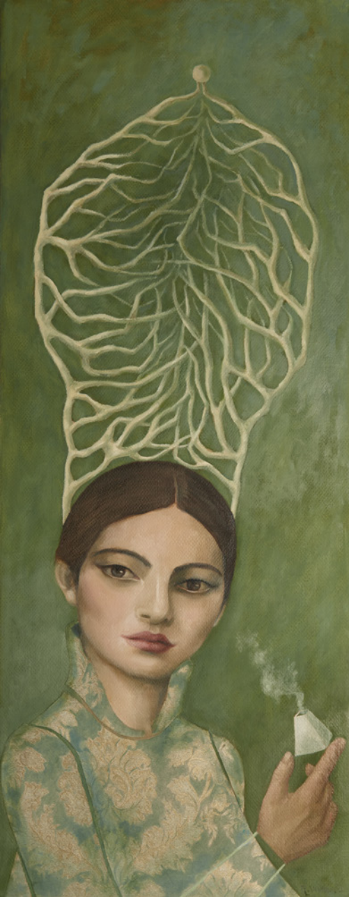
Entrelazados, albergas los ciclos en unidad perfecta Óleo/papel 87,5 x 35 cm.