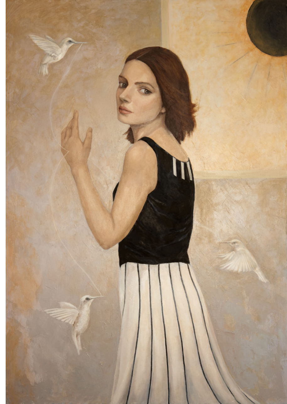
Sol Níger Óleo/tabla 116 x 81 cm.