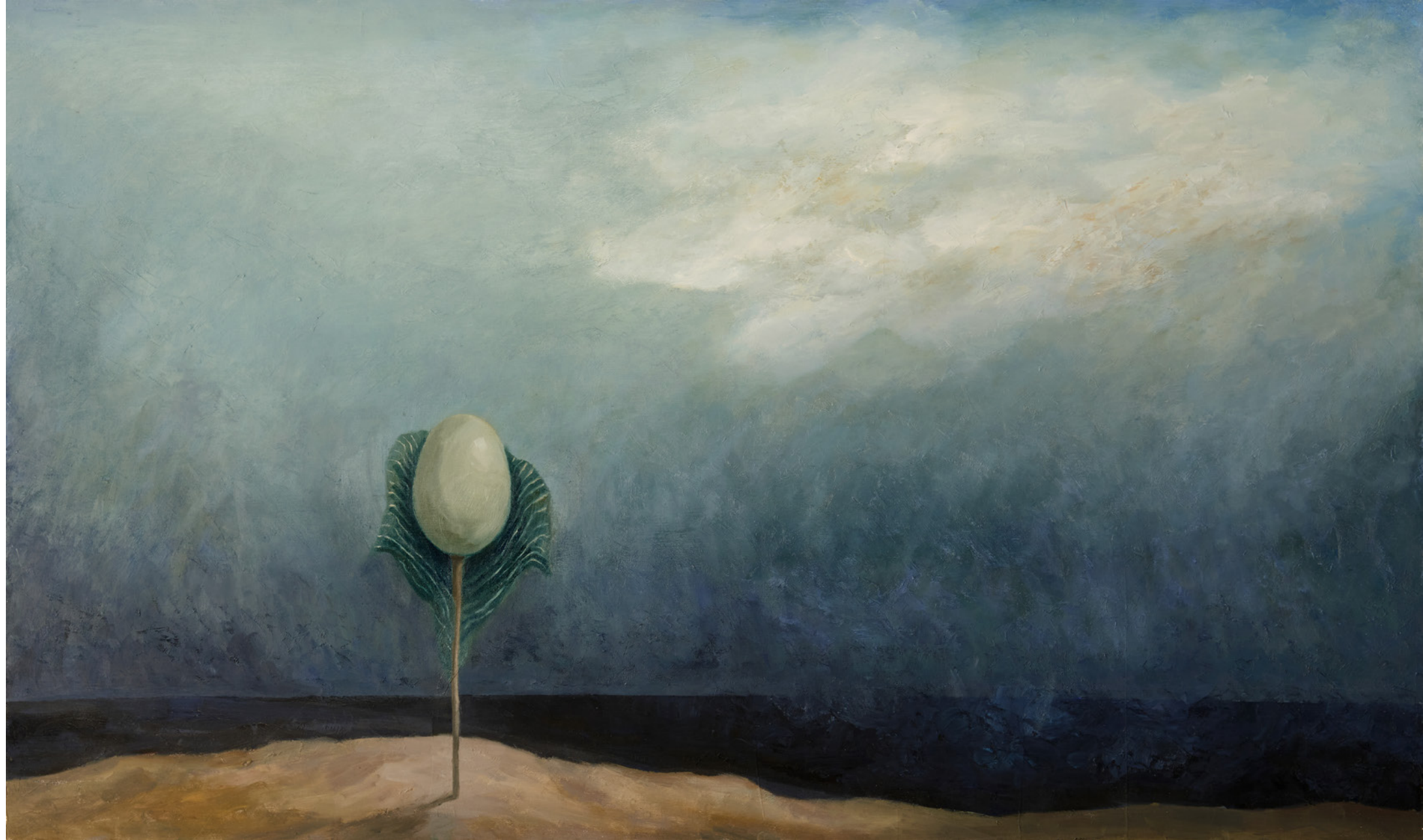
Bajo la cúpula celeste Óleo/tabla 42 x 70 cm.