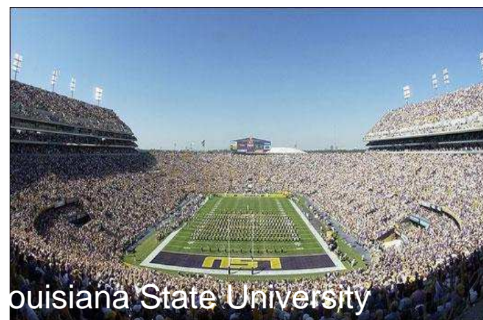
Louisiana State University