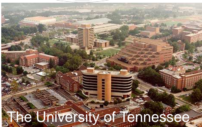
The University of Tennessee