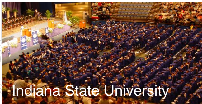
Indiana State University