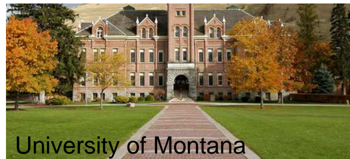
University of Montana