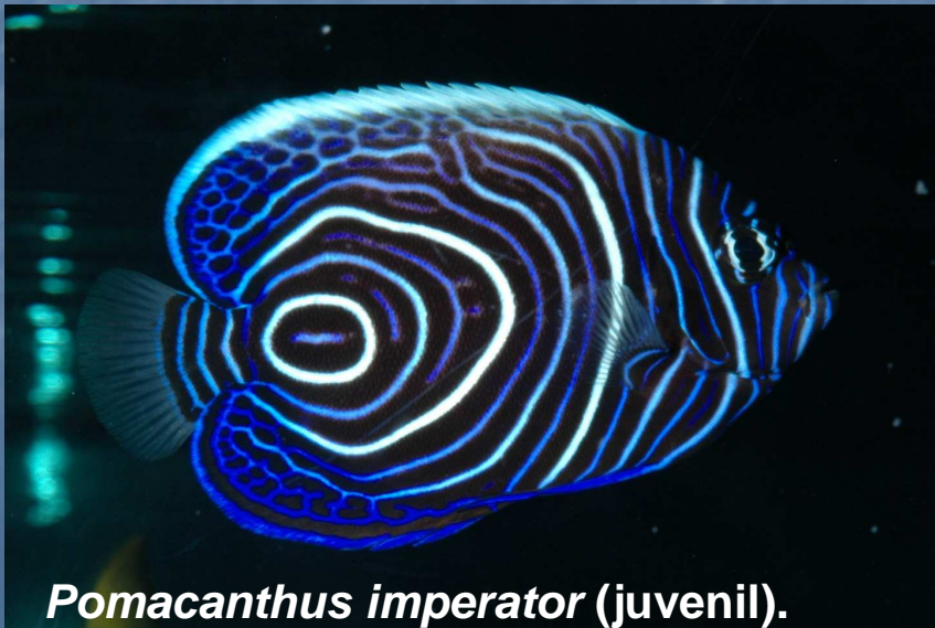
Pomacanthus imperator (juvenil).

El pez ángel emperador está presente en aguas del Océano Índico y Pacífico.