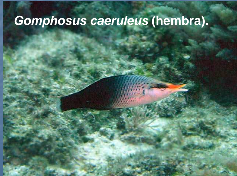
Gomphosus caeruleus (hembra).

El pez pájaro, se distribuye desde el Mar Rojo y toda la costa oriental africana hasta el Pacífico occidental. Su boca con forma de pico y su forma de nadar, al mover las aletas como si estuviese volando, le han dado su nombre común. Vive en zonas de arrecife y se alimenta de invertebrados que encuentra entre los corales.