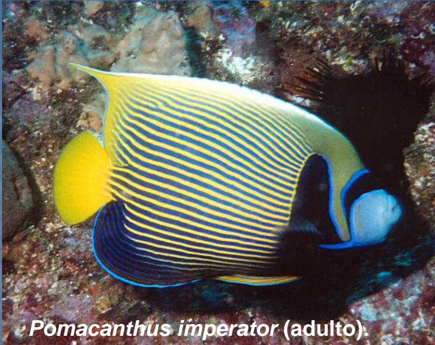
Pomacanthus imperator (adulto).