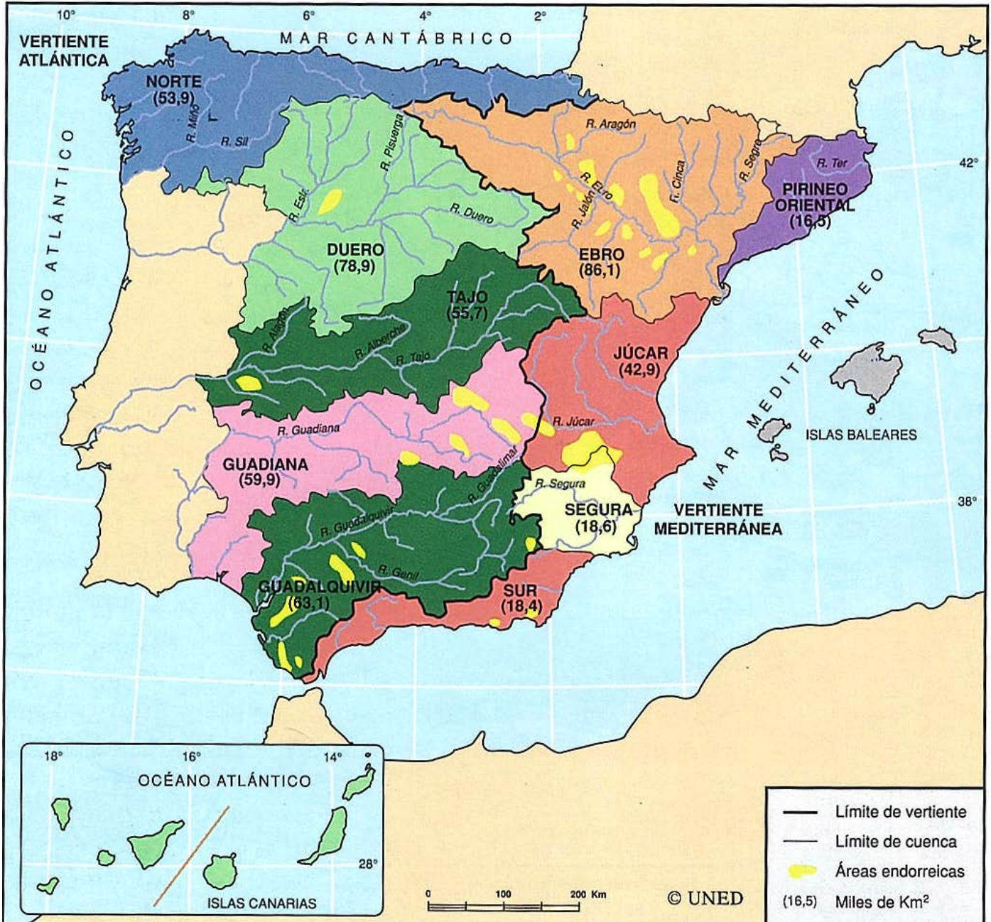
Figura nº1: Las vertientes y demarcaciones hidrográficas españolas