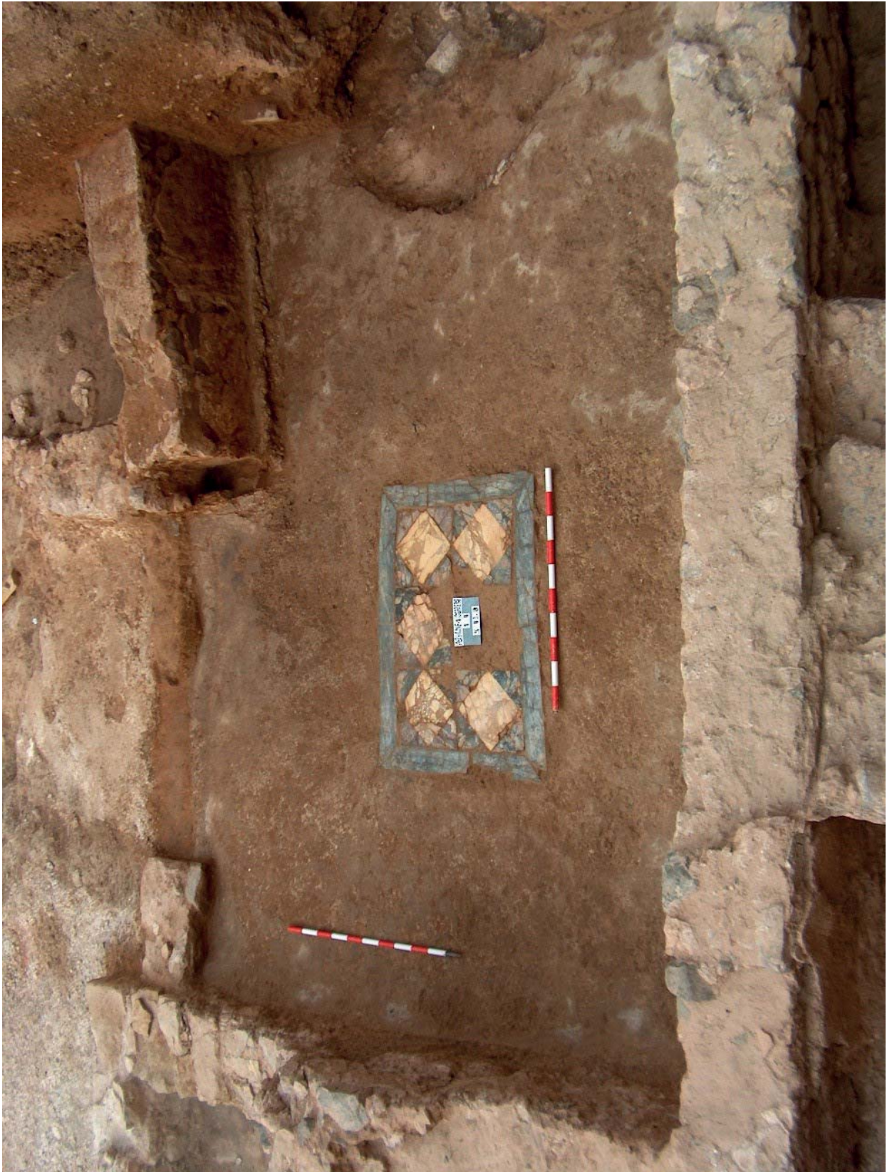
Imagen del yacimiento excavado.