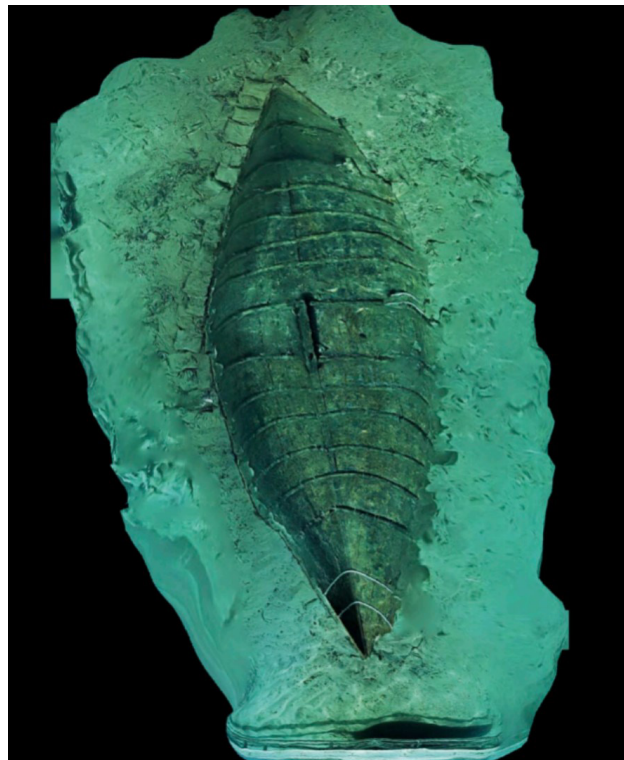
Figura 4. Pecio Mazarrón II.

del siglo VII y el final del siglo VI a.C. 67 , esta ánfora concreta, por su morfología y la estratigrafía de otros yacimientos, Ramón Torres la data entre finales del siglo VII e inicios del VI 68 . Una hipótesis descartada de su hundimiento sería su sobrecarga, sin embargo, la capacidad máxima que podría tener dicho barco, en relación con los datos del Mazarrón-I, hacen que esta hipótesis se suprima 69 .