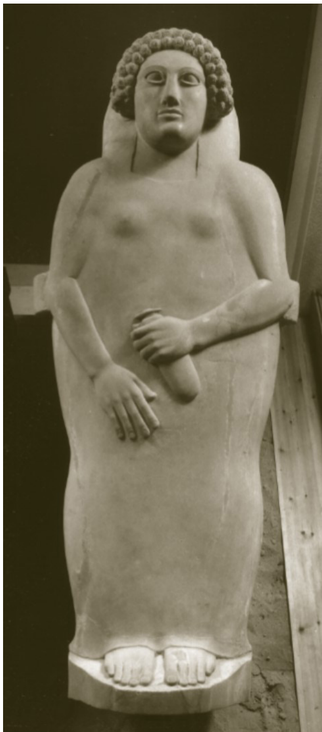
Figura 3. Sarcófago femenino de Cádiz. Fuente: Martín Almagro Gorbea et al. 2010: 377.

a torno, representado principalmente por vajillas, empleadas para el consumo de alimentos, y ánforas, utilizadas para el transporte de productos, tales como grano o pescado, entre otros 55 .