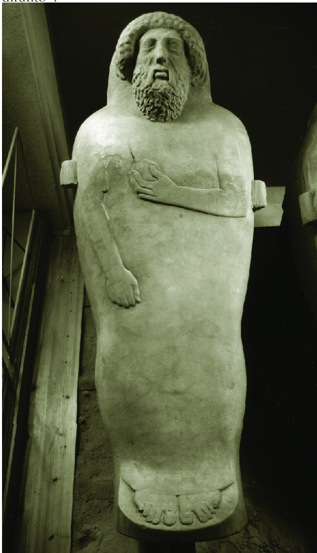
Figura 2. Sarcófago masculino de Cádiz.

con la mano en la pelvis. Es posible que porte unas sandalias, aunque los pies parecen estar desnudos 45 . Es importante mencionar que la cara del sarcófago masculino, bastante lograda, se encuentra bastante erosionada. El sarcófago data entre los siglos IV y V a.C. 46 y no presenta ajuar, salvo un pequeño contenedor cerámico, y en el interior del mismo solo se encuentran restos de la tela del sudario, y la caja de madera del difunto 47 .