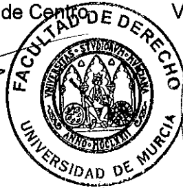
Fdo.: Ignacio González García