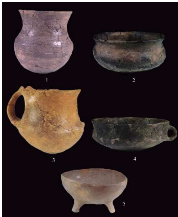
Figura 2. Padru Jossu, Sanluri: Cerámicas Campaniformes (AA.VV., 1998: 319, 320, 322, relaboradas por C. Pau).

Podemos suponer que se realizaran rituales de sacrificio de animales, lo que quedaría atestiguado por la presencia de huesos de animales, en muchos casos de ovicápridos y suinos y por la presencia de un canaletto en el altar en roca, donde seguramente corría la sangre de las víctimas (UGAS 1998: 276-277). La misma morfología de las cerámicas corroboraría esta teoría ( fig. 2. ), el típico vaso ( fig. 2. 1. ), las tazas, las jarras, pueden ser interpretados como contenedores de bebidas. En el caso del vaso campaniforme podía tratarse de agua