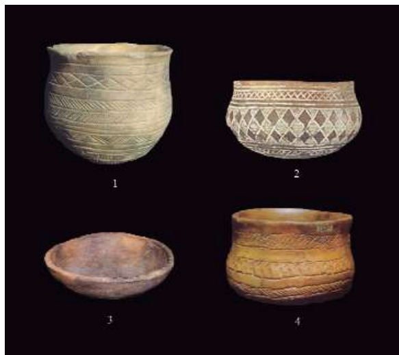
Figura 4. Fosso Conicchio, Viterbo: Cerámicas Campaniformes (AA. VV., 1998: 198, COCCHI GENICK, 2009: 249 fig. C1.2; FUGAZZOLA DELPINO, PELLEGRINI, 1998: 182, reelaboradas C.Pau).

el estrato superior sector Norte; 2. Uno o dos grupos formados por: dos vasos campaniformes y tres de acompañamiento encontrados en el estrato intermedio sector Noroeste; 3. Un grupo formado por: vaso campaniforme, brazalete de arquero, una taza encontrada en el estrato intermedio delante de la plataforma; 4. Un grupo formado por: fragmentos de vaso campaniforme, brazalete de arquero, elemento en hilo de plata, un punzón en cobre, microlito geométrico en sílex, un vaso encontrado en el estrato intermedio del sector Sureste; 5. Un grupo formado por: un tazón, con decoración en estilo campaniforme, dos tazas, dos vasos, un contenedor y un fragmento de vaso encontrado en el estrato del pavimento del sector oeste; 6. Un grupo formado por: vaso Campaniforme, un tazón, probablemente una taza, encontrada en el estrato de pavimento del sector sur). Según Fugazzola Delpino y Pellegrini, cada uno de los tres estratos individuados en la estructura, comprende al menos un grupo de objetos, que constituyen un conjunto análogo a los del “set campaniforme” solitamente hallado en contextos funerarios, por lo tanto, como en los ajuares funerarios campaniformes, en Fosso Conicchio el ritual parece subrayar el estrecho lazo entre la “ideología Campaniforme” y los individuos que lo habían realizado o que habían participado en el, aunque en este caso específico parece que los participantes masculinos habían sido en mayor número (FUGAZZOLA DELPINO, PELLEGRINI, 1999: 145-146).