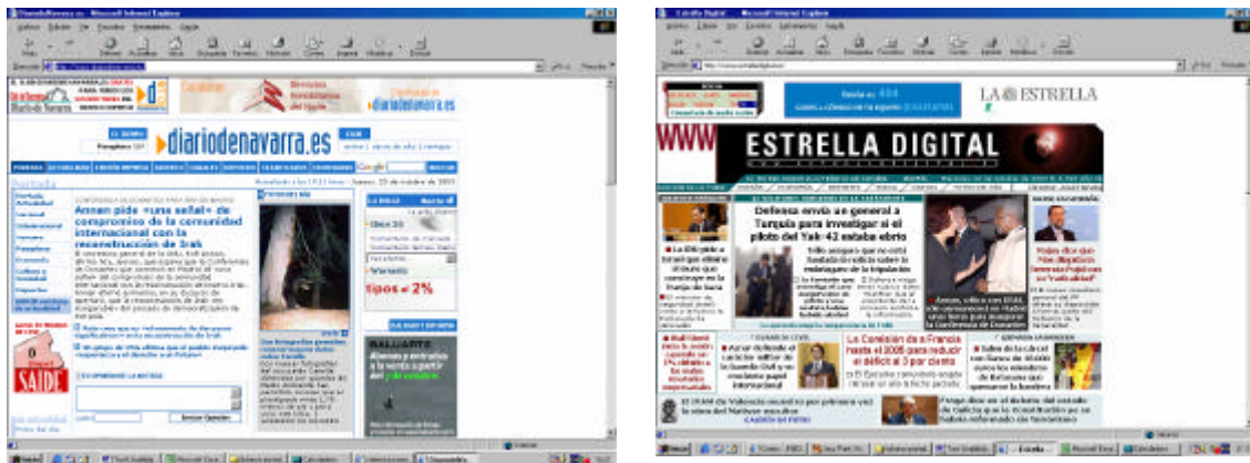
Fig. II. Diario de Navarra y Estrella Digital resultaron ser las páginas de inicio menos usables

En una escala de 0 a 10 los resultados oscilaron entre 4'5 (Diario de Navarra) y 7'09 (Vilaweb).