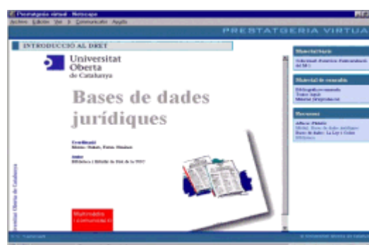
4. Ejemplo de material docente

En concreto, se explican con detalle publicaciones oficiales, bases de datos jurídicas y también bases de datos bibliográficas especializadas en derecho. El material se complementa con una serie de ejercicios prácticos, donde el estudiante debe utilizar estos recursos y donde debe también interpretar leyes y sentencias.