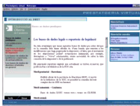
3. Ejemplo de material docente

Bases de dades jurídiques: material elaborado junto con la dirección de estudios de Derecho. Se trata de un material en formato web donde se forma al estudiante en las fuentes de información jurídicas, que tendrán que utilizar a lo largo de su carrera como estudiantes y profesionales y que les serán imprescindibles para localizar disposiciones legales, sentencias y documentación especializada.