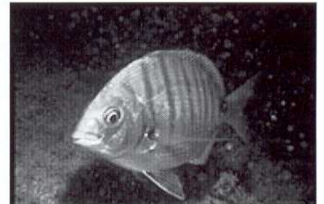
Diplodus sargus (sargo común)

Por último resaltar que desde 1989 tanto las comunidades ícticas como las bentónicas, así como los efectos directos e indirectos de la protección de áreas marinas están siendo estudiadas por investigadores de la Universidad de Murcia (grupo de investigación: Ecología y Ordenación de Ecosistemas Marinos Costeros). De hecho, durante este año se está llevando a cabo el seguimiento del impacto de los buceadores en la reserva marina de Cabo de Palos mediante un convenio de la Universidad de Murcia y la Consejería de Agricultura, Agua y Medio Ambiente ( http://dialogo.ugr.es/ ), así como el estudio de otros efectos indirectos de la protección (efecto cascada, exportación de biomasa de adultos, reclutamiento, diversidad genética, etc).