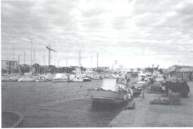
Puerto de Cabo de Palos

Cabo de Palos- Islas Hormigas ya que aunque es una zona fundamentalmente rocosa, también presenta praderas de Posidonia oceanica , fondos detríticos costeros, así como más de 12 pecios dispersos por todo el área, los cuales constituyen, un atractivo añadido para los buceadores. En la zona del Bajo de Enmedio es posible ver meros, corvinas, espetones, congrios, morenas así como bancos de castañuelas y doncellas. En las zonas del bajo de Dentro, isla Hormiga y Mosquito es posible encontrar a partir de los 30 metros Eunicella sp y sobre los 35-40 metros Paramuricea sp ambas especies de gran interés ecológico. Incluso en determinadas épocas son frecuentes los avistamientos de cetáceos tales como calderones y delfines.