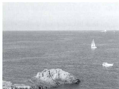
Aspecto general de la reserva.

Es ya en los últimos años del siglo XX, cuando Cabo de Palos comienza a ser objeto de múltiples e importantes transformaciones: positivas y negativas. Entre las primeras, destaca la declaración en 1995 de la Reserva Marina de Cabo de Palos-Islas Hormigas, por la Consejería de Agricultura, Ganadería y Pesca (Decreto 15/1995, de 31 de marzo) con el fin de proteger a las comunidades marinas y a las poblaciones de organismos de interés pesquero que en ella se desarrollan. Dicha reserva tiene una forma rectangular con una superficie de 1898 hectáreas y comprende aguas interiores (35% aproximadamente) y exteriores (65% restantes) siendo su gestión compartida por la administración autonómica (Consejería de Agricultura, Agua y Medio Ambiente) y la estatal (Ministerio de Agricultura, Pesca y Alimentación).