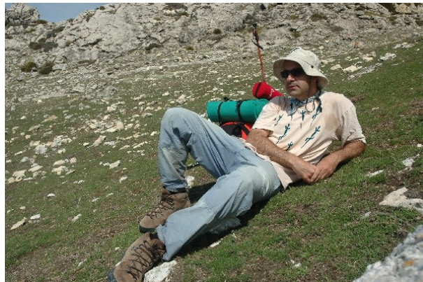
Figura 6. Un autorretrato en el collado previo a la cima del Picón del Royal. Voy bastante torrado pero sólo me queda una cumbre para completar la travesía.

Por fin, la pendiente comienza a ceder y el vértice se adivina; acelero y dejo la mochila junto a mojón de cemento para acercarme hacia Poniente y verificar la ruta de salida. Un vistazo rápido para comprobar con satisfacción que no me esperan más sorpresas y que sólo queda un prolongado descenso esquiando entre las piedras del Pecho de las Ardillas.