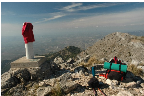
Figura 3. En la cumbre del Gilillo y mirando hacia el Noroeste se observa la campiña andaluza y los olivares. El pueblo de Cazorra está justo bajo el cerro con pinos que se observa en el centro de la imagen.

cordillera de los Agrios, bajo la imponente mole del Picón del Royal. El carril pronto tiene una cadena que cierra el paso a los vehículos y unos kilómetros más adelante se convierte en un jorro o carril de saca para los madereros.