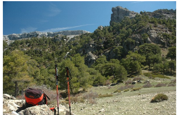
Figura 2. Primera parada para comer algo bajo los contrafuertes del Picón del Guante.

Así pues, muchos, cuando por primera vez fuimos a cazorla y nos metimos en la famosísima ruta del Borosa, realmente no estábamos en Cazorla, sino en otra parte... Podemos pensar que estos detalles son cosas de geógrafos y que no interesan; podemos argumentar que las montañas apenas entienden de límites y mojones y son lugares para ser disfrutados sin preocupación. No obstante, el tema de los nombres, los topónimos, es vital y uno no debe hablar a la ligera cuando ya ha pateado mucha sierra, porque los nombres terminan por ser la esencia de las cosas en un paisaje donde se pierden las veredas y se derrumban los cortijos acosados por la maleza, los años y el olvido.