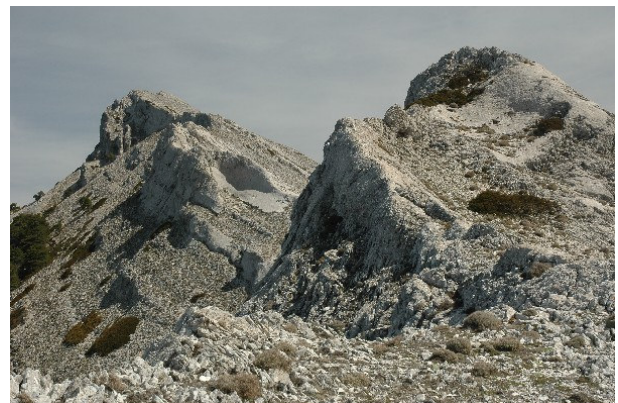
Figura 5. Como si de un paisaje lunar se tratara, la arista de la cordillera de los agríos se presenta entrecortada, blanquecina y muy abrupta. El pico de la izquierda es el Picón del Guante. Ahora voy a comenzar la subida al Picón del Rayal.

Desde la cima veo claro toda la cuerda que me resta para terminar la jornada. Como hace un arco hacia el oeste puedo estimar correctamente la escala del conjunto, los pasos delicados y las dos cimas que me restan. Todavía no se puede cantar victoria y aún va a haber que pelear muchos metros.