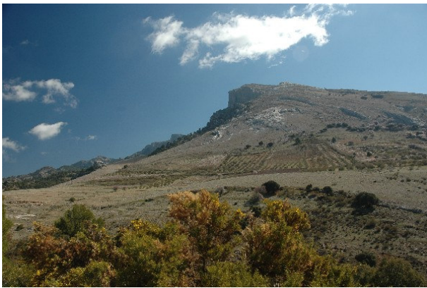
Figura 1. La ladera del Picón del Royal que cae hacia el Puerto de Tíscar se conoce como Pecho de las Ardillas por su color blanquecino que resalta al sol y que se ve desde cientos de kilómetros de distancia.

Por integral en montaña se entiende el efectuar todas las cimas de una sierra, conjunto de sierras o sistema. Puede parecer exagerado hacer todas las cimas de Cazorla en un par de días pero es que hay que definir claramente los límites geográficos de la Sierra de Cazorla en el sentido de que, a menudo, es usual tomar el todo por la parte y llamar Cazorla a lo que es Sierra del Pozo, Sierra de las Villas, o Sierra de Segura por citar otras sierras vecinas.