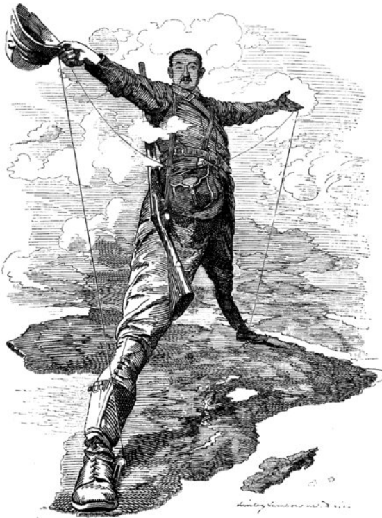
Caricatura de revista satírica inglesa Punch que publicaba una caricatura de Cecil Rhodes.

Pero al referirnos al neocolonialismo de las transnacionales hemos de ser cautos en el análisis, si bien es cierto que la proliferación de pactos de poder entre grandes compañías transnacionales y estados corruptos es un producto de las postrimerías del siglo XX, no es menos cierto que el proceso comenzó mucho antes.