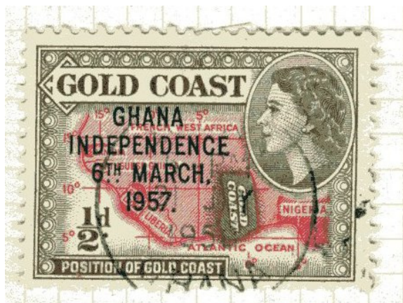
Estampa postal dedicada a la independencia de Costa de Oro de la Gran Bretaña con una joven Isabel II. .

del Sur con la perpetuación de las élites gobernantes y, por tanto, la paradoja de la re-producción del colonialismo en la propia "Independencia".