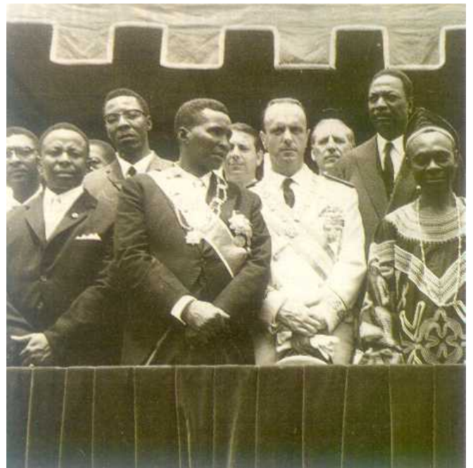
Imagen de la independencia de Guinea Ecuatorial con la presencia de Manuel Fraga como representante de España y el Presidente Macías.

del tráfico de drogas de África Occidental y ha llevado al país al ranking de los más corruptos del planeta.