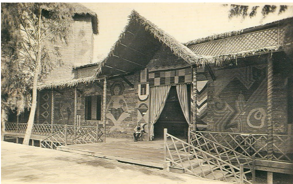
Imagen del pabellón de las posesiones españolas de Guinea en la Exposición Ibero-Americana de Sevilla de 1929.

La política española del franquismo fue sumamente despiadada con esta colonia «controlada hasta la descolonización por el Banco Exterior de España, el Comité Sindical del Cacao, Proguinea del Café o el Sindicato de la Madera. El malestar por el expolio contribuyó a la formación del movimiento nacionalista que hizo su aparición en 1958, contagiado por los resultados marroquíes y la lucha argelina, pero no tuvo éxito alguno y sus líderes fueron encarcelados o tuvieron que exiliarse (...) hasta el 12 de octubre de 1968 que se forma la República de Guinea Ecuatorial.» (Nicolás Marín, 2005: 208s). Pero tras la trayectoria descolonizadora de Guinea comenzaba un penoso decurso del país gobernado por Francisco Macías Nguema, antiguo funcionario de la administración colonial, uno de los dictadores más crueles ejecutado en 1979. No obstante, su sucesor y sobrino, Teodoro Obiang Nguema, tras un golpe de estado en ese mismo año continuó gobernando –hasta hoy mismo– perpetuando el poder dictatorial bajo las premisas propias de la época colonial. 8