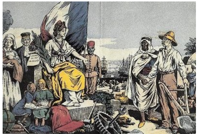
Ilustración sobre el interés civilizador del estado francés.

Y es que la realidad comporta análisis científico críticos desde posturas radicales y desde profundos análisis del conocimiento y estrategias de los discursos del poder. No es plausible hablar de los problemas del Tercer Mundo 6 , o mundo subdesarrollado, sin observar su decurso histórico. Así, la realidad del continente africano es mucho más compleja que reducirla a una sola entidad abstracta. África es mucho más que un continente subdesarrollado. Es ante todo el fruto del desconocimiento de Occidente, que se atribuye el poder de esclavizar y colonizar, de apropiarse los recursos materiales y de descolonizar y, por tanto, abandonar territorios al socaire de golpes militares o elites gubernamentales que sostienen relaciones geoestratégicas con multinacionales, manteniendo toda una masa informe de pobres, no sólo en el sentido económico sino también en el estado de aislamiento e imposibilidad de manifestación alguna, de exclusión política. Pero no sólo en el continente africano, también en otros países del mundo las libertades son coaccionadas de forma explícita o bien virtual, donde la población bajo un discurso de aparente democracia vive sometida al imperio de un estilo de vida que ahoga la libertad y la felicidad.