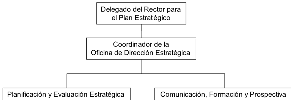
Figura 2: Organigramma de la ODE.