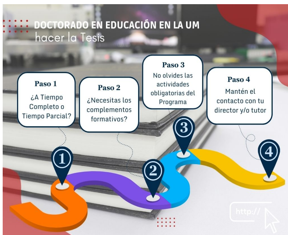
Figura 2: Decisiones importantes en el Doctorado en Educación