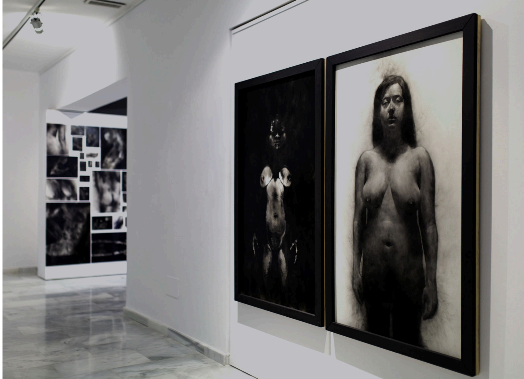
Dualidad(es) I , (2015 - 2016). Díptico, humo sobre melamina. 140 x 170 cm