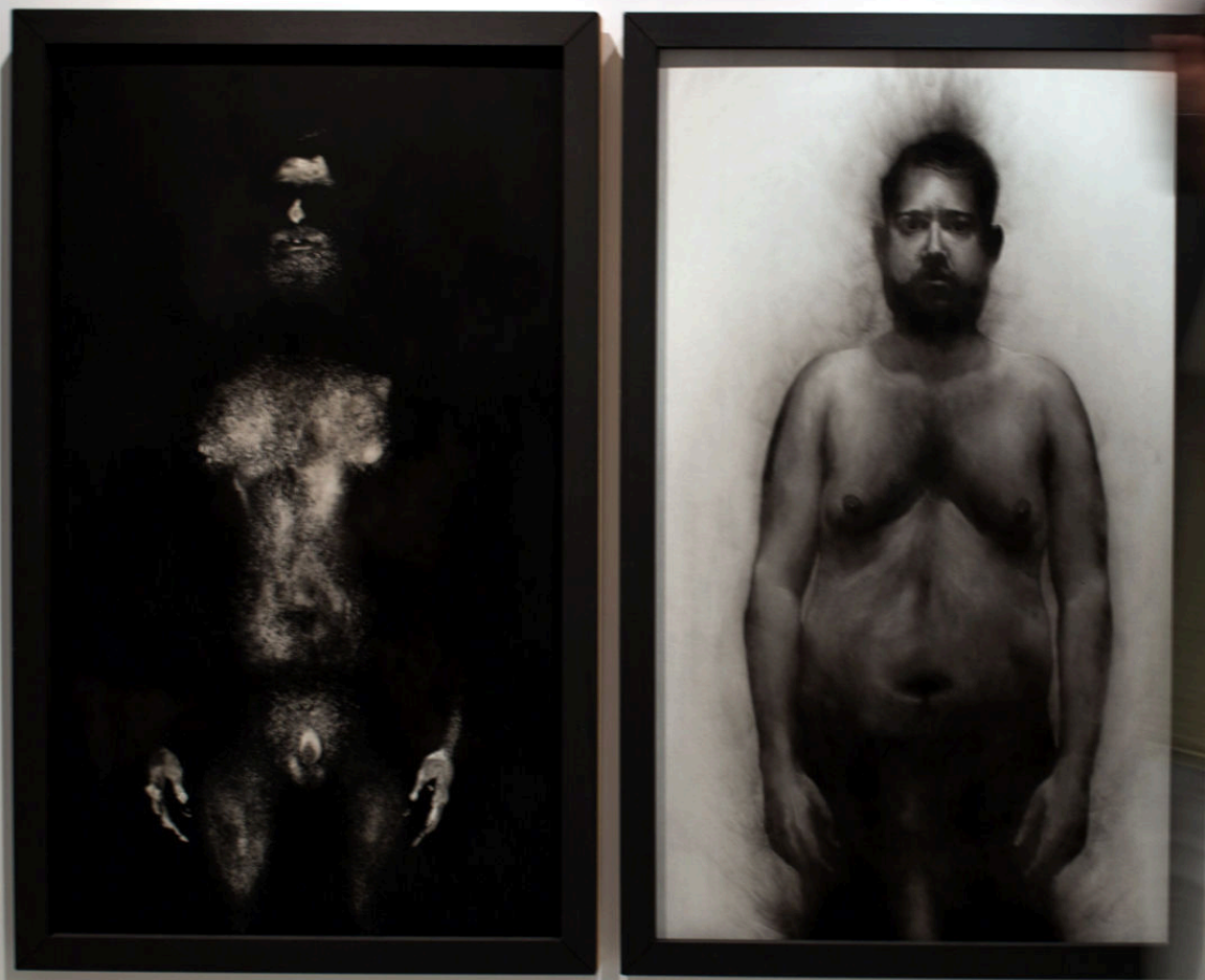
Dualidad(es) III , (2015 - 2016). Díptico, humo sobre melamina. 140 x 170 cm