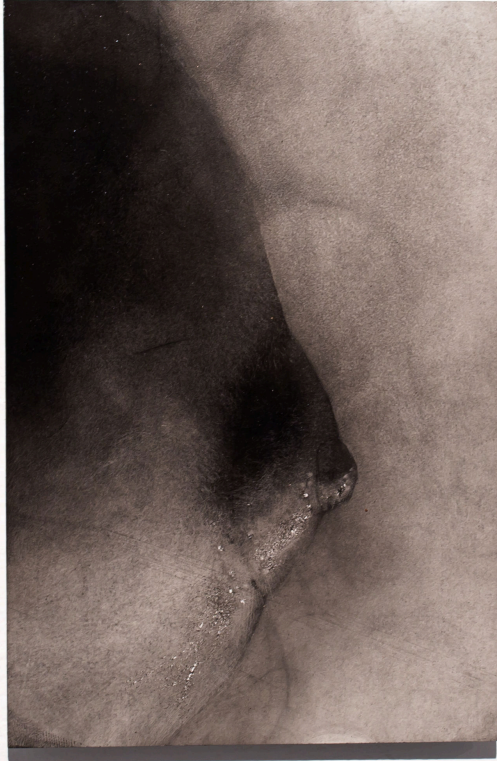
S/T , (2017). Humo sobre melamina. 20 x 15 cm