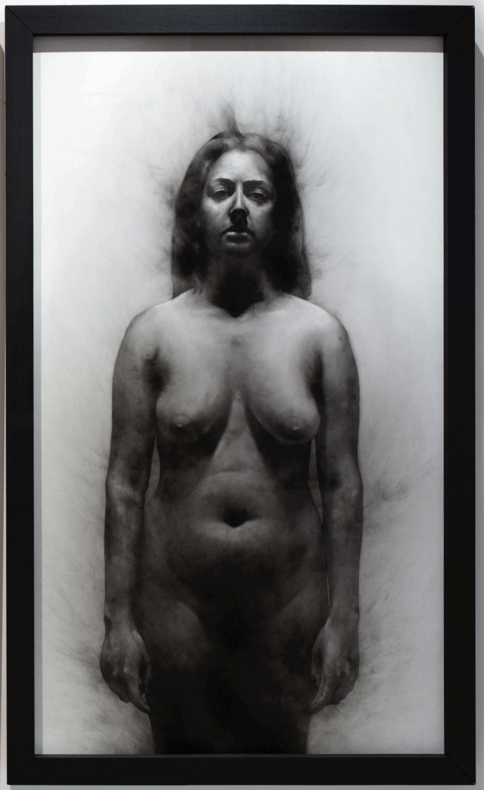
Dualidad(es) IV , (2015 - 2016). Díptico, humo sobre melamina, 140 x 170 cm