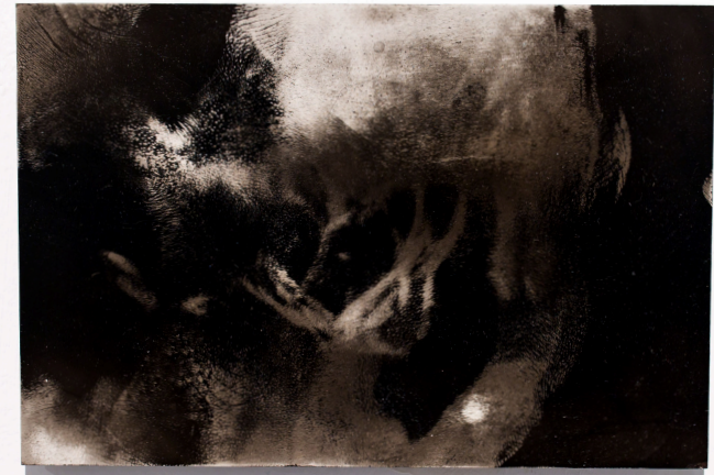
S/T, (2017). Humo sobre melamina. 20 x 15 cm