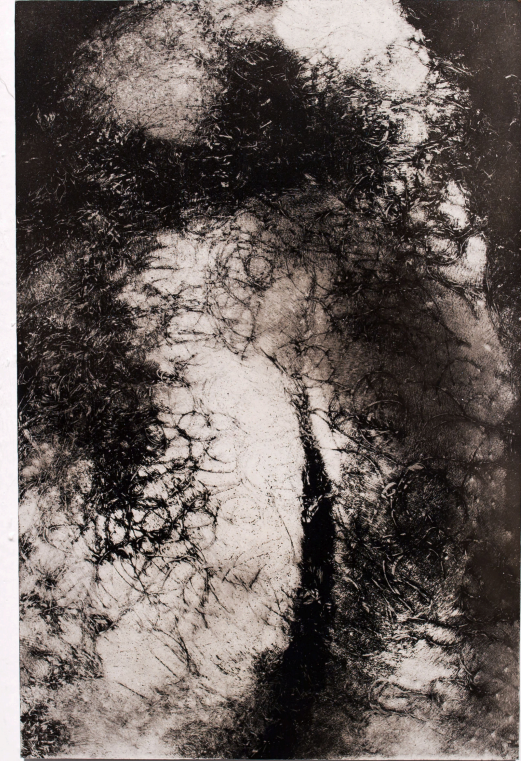
S/T , (2017). Humo sobre melamina. 20 x 15 cm