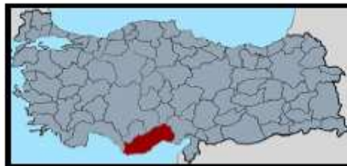
Mersin Region / Turkey