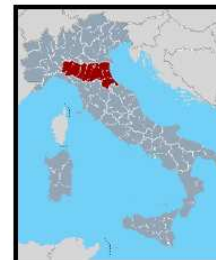
Emilia-Romagna Region / Italy