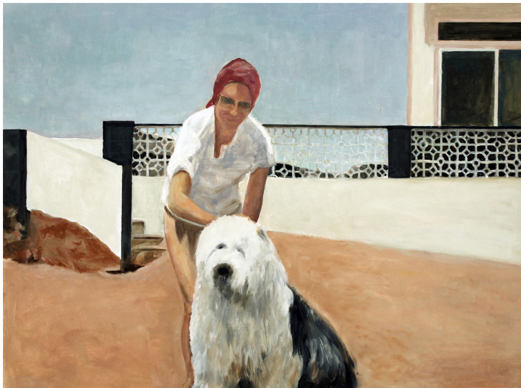
De no ir solos María Jesús Ferrer Díe óleo/madera. 70 x 100 2015