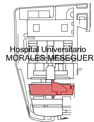
SITUACIÓN EN PLANTA 2ª