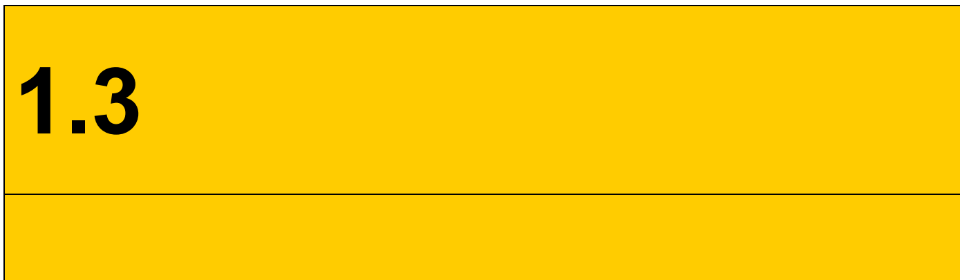
Figura 2: Rótulo de señalización terminal en las puertas con código de identificación en el edificio Luis Vives.

En las puertas de los despachos de profesores el cartel disponible tiene exactamente la siguiente disposición (pongo el de mi despacho como ejemplo) y está reproducido a escala 1:1 en la Figura 3. Téngase en cuenta que la parte de abajo inicialmente estaba en blanco y cada profesor pone ahí lo que estima oportuno. Lo mínimo que por normativa debe ponerse es el Horario de Atención a alumnos semanal. Otros ponen el nombre completo y su titulación académica (en amarillo los rotulistas sólo pusieron la inicial del nombre y un apellido, dado que con ese tamaño de letra no cabe mucho más), Departamento o Area al que pertenecen, teléfono del despacho, e-mail, etc. No obstante, téngase en cuenta que estamos hablando de una franja de 3 cm de alto por 18 cm de ancho y si se quiere meter mucha información tiene que ser a costa de tamaños de letra muy pequeños, que sólo se leen acercándose mucho al rótulo.