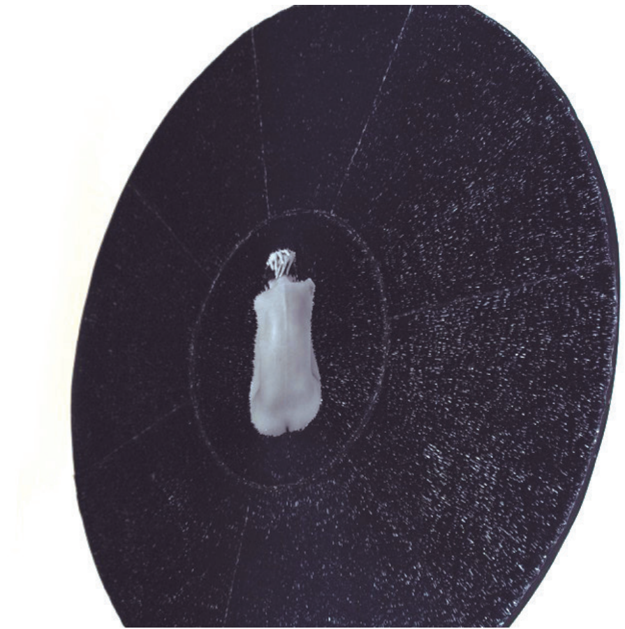
Carmen Baena Cosido en la memoria Fotografía analógica e hilo bordado sobre papel 90 cm. de diámetro 2015